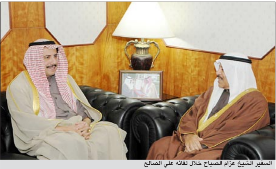
السفير الشيخ عزام الصباح خلال لقائه على الصالح

النامية - كونا: أكد رئيس مجلس الشورى البحريني علي الصالح ان الكويت كانت دوما خير عون للبحرينيين عند الحاجة موضحا ان العلاقة بين البلدين ممتدة وقائمة على التاريخ والمصير المشترك وعميقة على المستويين الرسمي والشعبي. وقال الصالح خلال استقباله سفيرنا لدى مملكة البحرين الشيخ عزام الصباح امس انه رغم المنغيات الكبيرة التي تمر بها المنطقة «الا أننا وبحدالماله بخير بفضل قادتنا وشعبونا الخيرة» داعبا الى المزيد من التنسيق بين دول مجلس التعاون في ظل هذه التغيرات. من جانب آخر أشاد الصالح بدور السفير