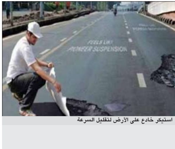
استبحر خادع على الأرض لتقليل السرعة

كيتين - وكالات: ارسل المحامون لدى شركة آبل رسالة تحذيرية للشركة الصينية المصنعة للمعبىة تطالب فيها بسحب الدمية من الأسواق فوراً. لكن صرح مالك الشركة الصينية بأن آبل لا تستطيع فعل شيء بهذا الصدد وأنه سيستمر في تسويق اللعبة التي ان تصبح الرسالة