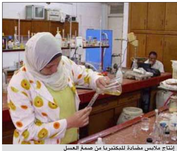
إنتاج ملابس مضادة للبكتيريا من صمغ العسل