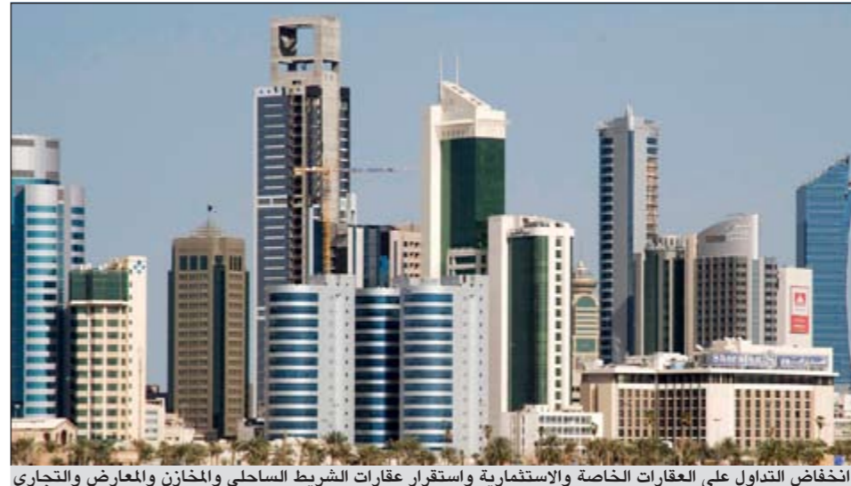
انخفاض التداول على العقود الخاصة والاستثمارية واستقرار عقود الشريط الساحلي والمخازن والمعارض والتجاري

وسجلت مبيعات النفط الكويتي الخام والمنتجات البترولية 400 ألف دولار فقط في عام 2004 لكنها تجاوزت حاليا عشرة مليارات دولار مدفوعة بشحنات الخام القوية.