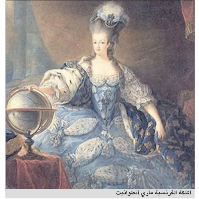
الملكة الفرنسية ماري أنطوانيت

كشفت إدارة الدورة الـ 62 لمهرجان برلين السينمائي (برلينالسه) في برلين اسم عن أن فيلمًا يتناول سيرة حياة الملكة الفرنسية ماري أنطوانيت والأيام الأولى من الثورة الفرنسية في عام 1789 سيفتتح المهرجان الذي ستنتقل أنشطته في التاسع من فبراير المقبل. ووفقًا لإدارة المهرجان فإن فيلم «وداعا ملكتي» الذي تجسد فيه نجمة هوليوود ديانا كروغر دور الملكة الفرنسية حظي باختيار ادارة المهرجان ليكون فيلم