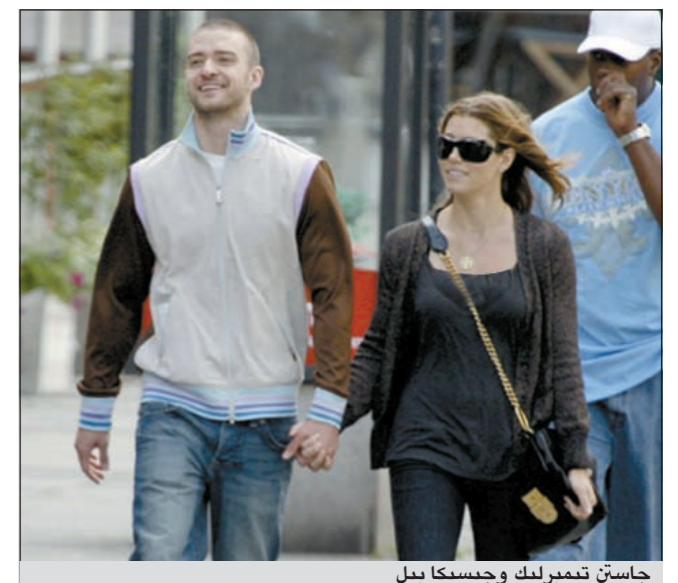
جاستن تيمبرليك وجيسكا بيل

لوس انجليس - د.ب.أ: ذكرت صحيفة «يو أس ويكلي» أن الممثل والمغني جاستن تيمبرليك وصديقه جيسكا بيل أعلنًا خطبتهما. وتردد أن تيمبرليك فجر ذلك النبا خلال عطلة عيد الميلاد في منتجج للتزلج، بحسب التقرير. وقال مصدر للمجلة: «جاستن يعلم كم هي (جيسكا) تحب التزلج على الجليد والجبال ولذا كان ذلك المكان المثالي (لإعلان الخطبة)». وجاء إعلان خطبة تيمبرليك (30 عاما) وبيل (29 عاما) بعد علاقة استمرت بينهما منذ عام 2007، رغم انفصالهما لمدة ثلاثة أشهر في مطلع عام 2011.