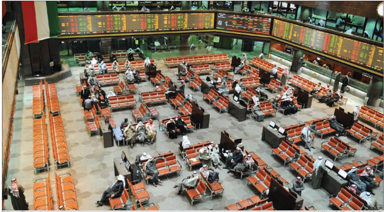
قاعة التداول شبه خالية من المتداولين (قاسم باشا)

أنهى سوق الكويت للأوراق المالية تعاملات الأسبوع على مواصلة الانخفاض الذي يشهده حالياً جراء استمرار عمليات البيع التي شملت العديد من الأسهم في جميع القطاعات، لتشهد الجلسة تخلي المؤشر الوزني عن مستوى 400 نقطة بعد استمرار التراجع اللافت لعدد من الأسهم القيادية والثقيلة.