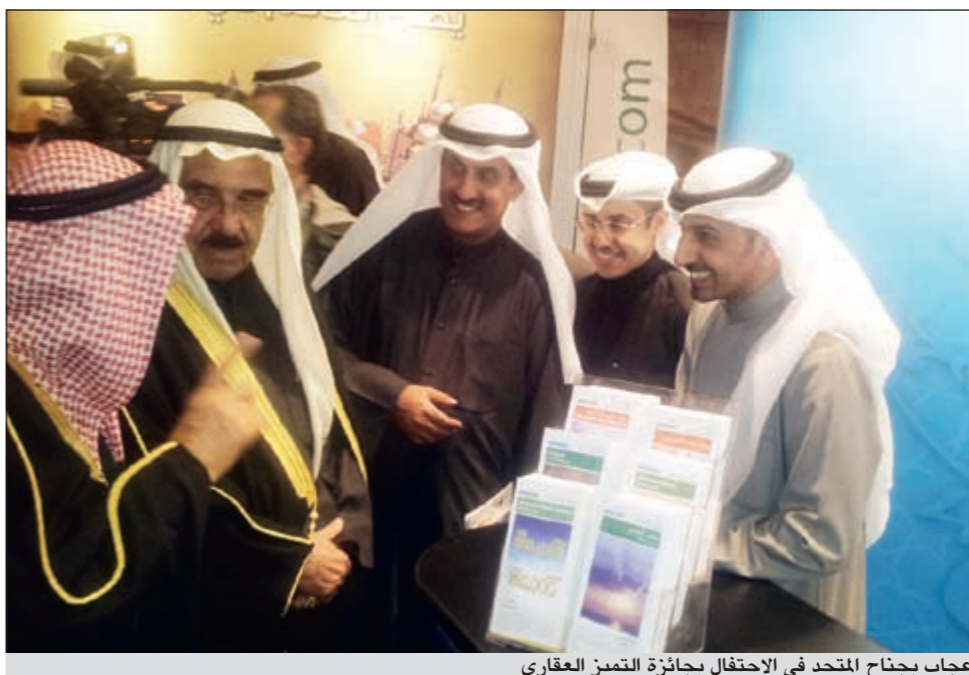
إعجاب بجناح المتحد في الاحتفال بجائزة التميز العقاري

وقد بلغ إجمالي القيمة المتداولة في السوق في هذا الأسبوع 66,8 مليون دينار بانخفاض حاد بلغ 44٪ عن الأسبوع السابق. وبالنسبة لقطاعات السوق فقد استحوذ قطاع الخدمات على النصيب الأكبر من القيمة المتداولة بنسبة بلغت 40,6٪ من إجمالي قيمة تداولات السوق، بينما جاء قطاع البنوك في المركز الثاني مستحوذاً على ما قيمته 16,8٪ من إجمالي التداولات، أما أقل القطاعات تداولاً فكان قطاع التأمين الذي استحوذ على ما نسبته 0,03٪ من إجمالي التداولات أما من حيث مستوى القيمة للأسهم المتداولة فقد كان سهم زين من أكثر الأسهم تداولاً فقد بلغ إجمالي التداول على السهم 9,85 ملايين دينار ما نسبته 14,7٪ من إجمالي القيمة المتداولة للسوق، يليه سهم البنك الوطني حيث بلغ إجمالي التداول على السهم