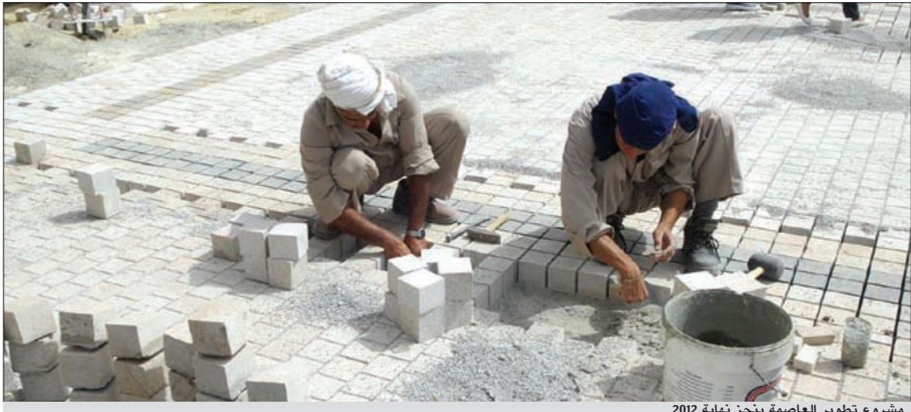
مشروع تطوير العاصمة ينجز نهاية 2012