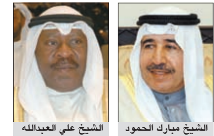
الشيخ مبارك الحمود، الشيخ علي العبدالله

تواصلت برقيات التهئة ورسائل مباركة من عشاق وقراء «الانباء» في عيدها الـ 36، مشيدون بدور «الانباء» الوطني وبمسيرتها العريقة في خدمة الكويت منذ صدور العدد الأول. وعبر نائب رئيس مجلس الوزراء ووزير الدفاع ووزير الداخلية الشيخ أحمد الحمود عن خالص تهانيه برسالة وجهها إلى رئيس التحرير الزميل يوسف خالد يوسف المرزوق، وقال الشبخة أحمد الحمود: نغير لکم عن بالغ اعتزازنا بالمسيرة الطيبة التي قدمتها جريدة «الانباء» لخدمه وطننا الحبيب وبمساهمتها الحادة في ترسيخ قيم ومبادئ مسيرة الصحافة الصادقة من خلال طرحها الرافعي والهادف في تناول مختلف القضايا ومواكبتها لجميع الأحداث بمهنية عالية. كما أرسل رئيس المراسم والتشريعات الاميرية الشيخ خالد العبدالله ببطاقة تهئة تقديرا منه لدور «الانباء» الاعلامي، وبدوره اعرب وزير الاعلام الشيخ حمد جابر العلي عن تهانيه لاسرة «الانباء» في عيدها، مستذكرا في الوقت نفسه مؤسس هذا الصرح المتميز المرحوم بان الله تعالى العم خالد يوسف المرزوق وما له من بصمات مضيئة وسيرة عطرة ومواقف شجاعة في مجال المبادئ محفورة في ذاكرة الوطن المعطاء لايزال يتردد صداها داخل الكويت وخارجها.