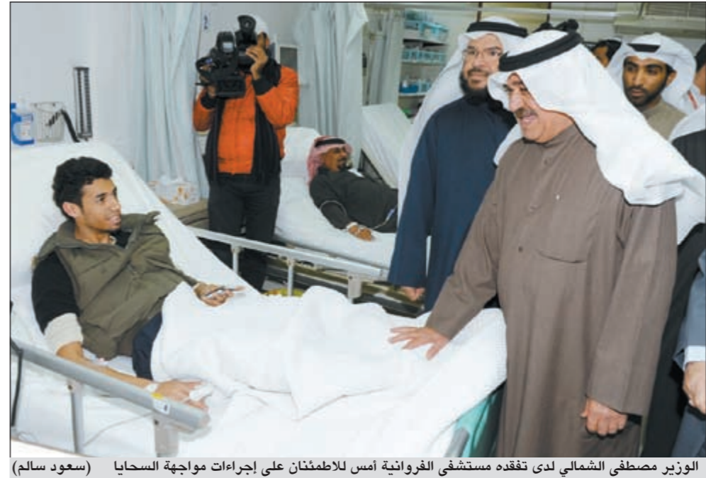
الوزير مصطفى الشمالي لدى تفقده مستشفى الفروانية أمس للاطمئنان على إجراءات مواجهة السحايا

الأمراض السارية هو المخول باستقبال مثل هذه الحالات، ولكن لا حياة لمن تنادي، وأشاروا إلى عدم وجود أي خطة طوارئ بالمستشفيات لمواجهة هذا الحدث والذي بدأت عدواه تنتشر مع رفض «السرارية» استقبال الحالات وعدم وجود أي غرف عزل في المستشفى نتيجة امتلائها؟