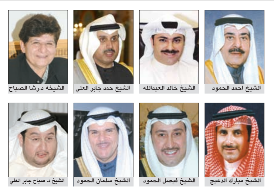
الشيخ أحمد الحمود، الشيخ خالد العبدالله، الشيخ حمد جابر العلي، الشبخة درشا الصباح

السرارية اعترض من مستشفى الفروانية عن عدم استقباله حالة لمرضى مصاب بالتهاب السحايا بحجة عدم وجود عناية مركزة في المستشفى، مما يترتب عليه علاجه في مستشفى عام، وقامت بإرجاع المريض إلى مستشفى الفروانية، حيث تكشف التقرير الذي تنشره «الانباء» عن هذه الواقعة. ويؤكد التقرير الثاني الذي تنشره «الانباء» أن غرف العزل في مستشفى الفروانية امتلات ولا مجال لإدخال أي مريض آخرين إلا بدخولهم إلى الأجنحة العمومية، خاصة أن مستشفى الأمراض السارية يرفض استقبال المرضى من الفروانية بحجة عدم وجود عناية مركزة، وتساعلت المصادر في الوقت ذاته أنه في حال دخول أي حالة أخرى فإين سيتم وضعها مع رفض «السرارية» استقبال الحالات وعدم وجود أي غرف عزل في المستشفى نتيجة امتلائها؟ التفاصيل ص 10