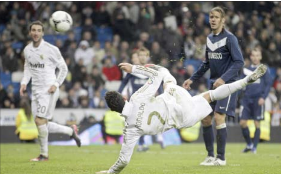
لعبة خلفية من نجم ريال مدريد كريستيانو رونالدو وسط متابعة زميله غونزالو هيغواين ومدافع ملقة