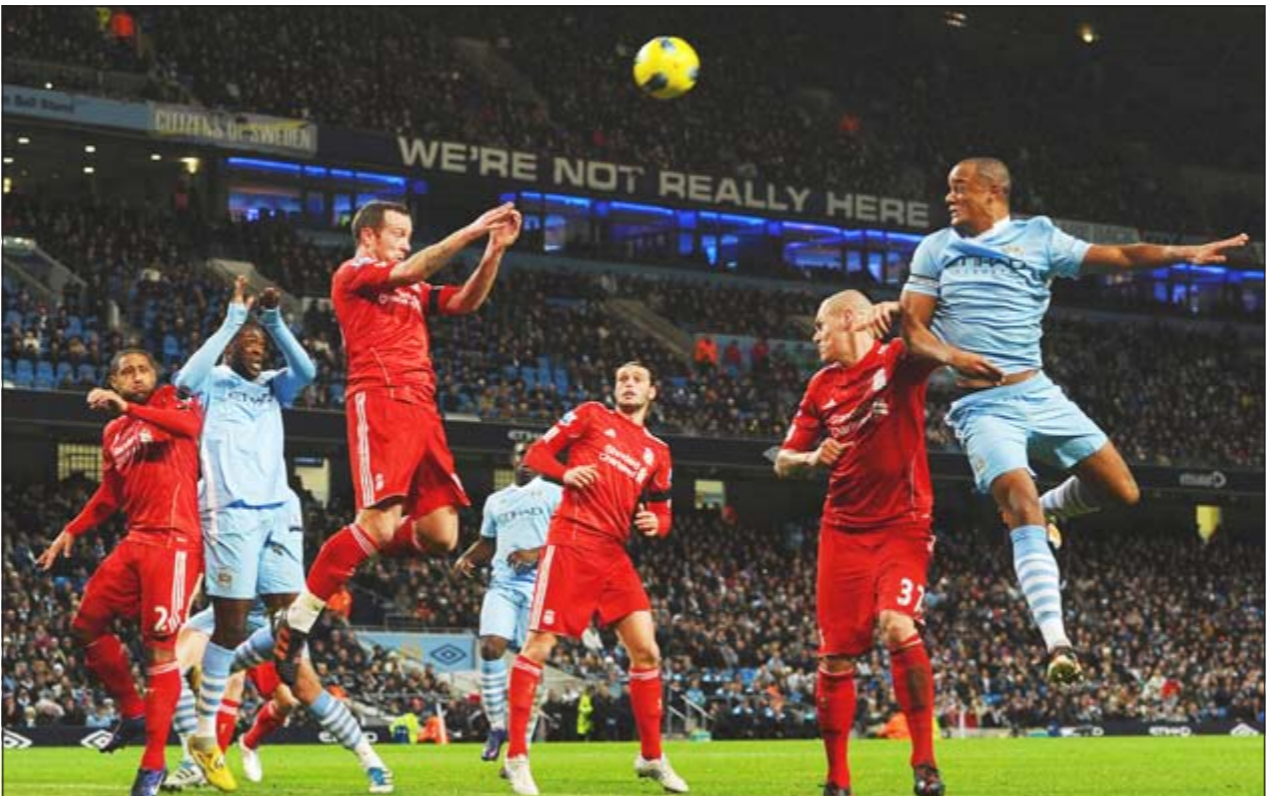
صراع فضائي على الكرة بين لاعبي مان سبتي وليقربول