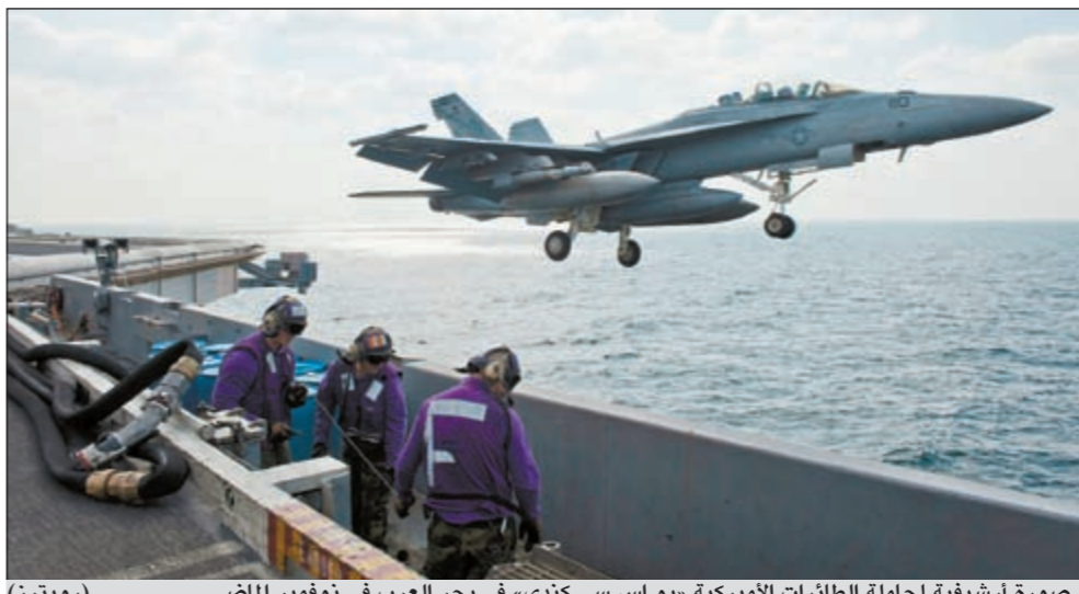
صورة أرشيفية لحاملة الطائرات الأميركية «يو اس سي كندي» في بحر العرب في نوفمبر الماضي