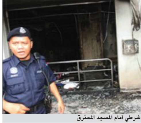
شرطي أمام المسجد المحترق

بكين - أ.ف.ب: وقعت اشتباكات في نهاية الأسبوع في شمال غرب الصين بين متظاهرين مسلمين وقوات الأمن التي كانت تدمر مسجدا. كما أفادت الشرطة ومنظمة للدفاع عن حقوق الإنسان أمس. ومع أن الشرطة أعلنت عن وقوع هذه الصدامات إضافة إلى اعتقالات، لكنها أكدت أنها لم تسفر عن أي قتيل، في حين أعلن المركز الإعلامي لحقوق الإنسان والديموقراطية ومقره في هونغ كونغ، أن شخصين قتلوا بيد قوات الأمن. وبدأت أعمال العنف في بداية نهاية الأسبوع عندما أرسلت الشرطة رجالا لتدمير مسجد جديد تم الإعلان للتو أن تشييده حصل بصورة غير قانونية في بلدة تاوشان، كما أوضحت المنظمة. وقتل شخصان وجرح 50 آخرون عندما عمدت الشرطة التي استخدمت الغاز المسيل للدموع، إلى ضرب متظاهرين بالهراوات، كما ذكرت المنظمة نقلًا عن سكان في رسالة عبر الفاكس.