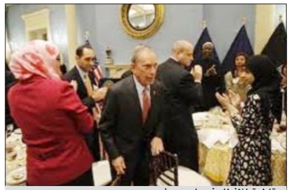
مقاطعة لإفتطار في بلومبيرغ

موسكو - وكالات: وجد 14 زعيماً من زعماء المسلمين في مدينة نيويورك في دعوة عمدة المدينة مايكل بلومبيرغ للمائدة السنوية للإفتطار وسيلة للتعبير عن رفضهم لما وصفوه بالرقابة الجائرة على المسلمين من قبل شرطة نيويورك، وذلك برفضهم لتلبية الدعوة. وبحسب «بي بي سي» فقد بعث زعماء المسلمين في نيويورك رسالة لبلومبيرغ عبروا فيها عن «الانزعاج والخاوف» التي تنتابهم إزاء تقارير أشارت بوضوح إلى خضوع المسلمين الذين يتشكلون نسبة 10٪ من سكان المدينة بشكل خاص إلى منظومة مراقبة عن كثب وجمع معلومات مستفيدة عنهم.