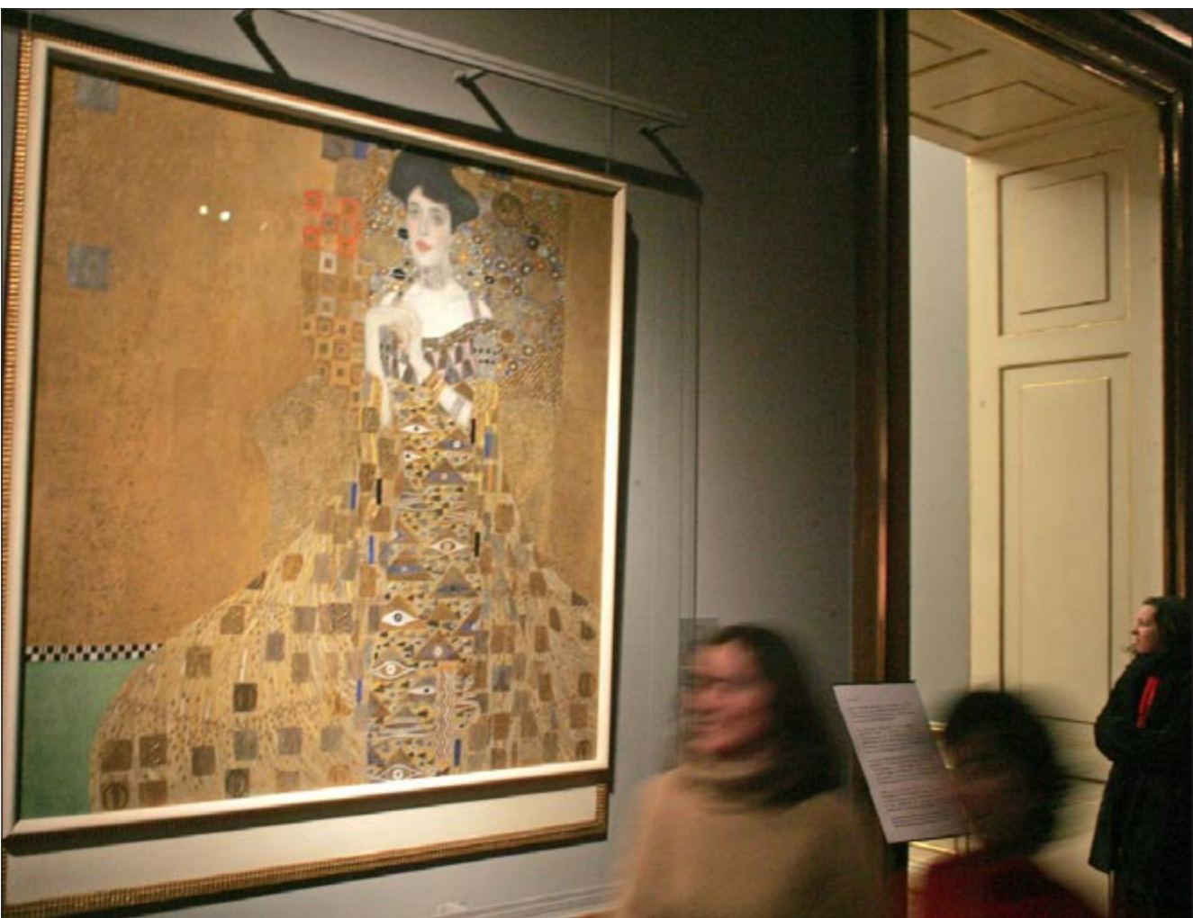
إحدى لوحات كليمت

لندن - يوبي.آي: كشفت صحيفة «انديبندنت» أن التحقيق الذي تجريه الشرطة البريطانية في اختراق أنظمة الحاسوب عثر على دليل يثبت تعرض رسائل البريد الإلكتروني المرسله والمتسلمة من قبل رئيس الوزراء البريطاني السابق غوردون براون للقرصنة خلال توليه منصب وزير الخزانة (المالية). وقالت الصحيفة إن فريقاً من محققى شرطة سكوتلند يارد وجد أن اتصالات براون الخاصة ورسائل البريد الإلكتروني العائدة الى المستشار السابق لحزب العمال ديرك دراير تعرضت لاختراق محتمل ويبحث حالياً في أدلة جمعها من 20 حاسوباً تتضمن معلومات تشير إلى احتمال تعرض رسائل البريد الإلكتروني لمئات من الأفراد للاختراق. وأضافت أن الروابط المكتشفة من أجهزة الكمبيوتر المصادرة تشير إلى أن التحقيق قد يشمل العديد من الضحايا وبمقدار ضحايا فضيحة التنصت على المكالمات الهاتفية التي تورطت بها صحيفة «نيوز أوف ذي وورلد»، وقادت الشركة المالكة «نيوز انترناشنال» لاحقا إلى أغلاقها في صيف العام الماضي.