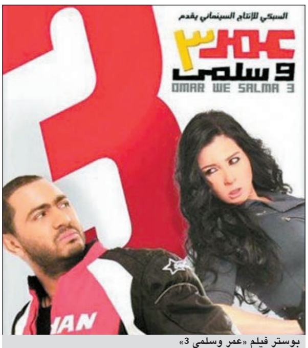
بوستر فيلم «عمر وسلمى 3»