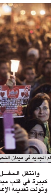
والشعور كانت حاضرة تخليدا لذكرى شهداء الثورة