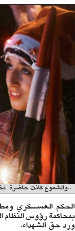
والشعور كانت حاضرة تخليدا لذكرى شهداء الثورة