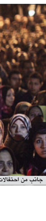
والشعور كانت حاضرة تخليدا لذكرى شهداء الثورة