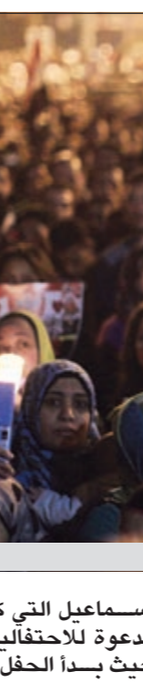
والشعور كانت حاضرة تخليدا لذكرى شهداء الثورة