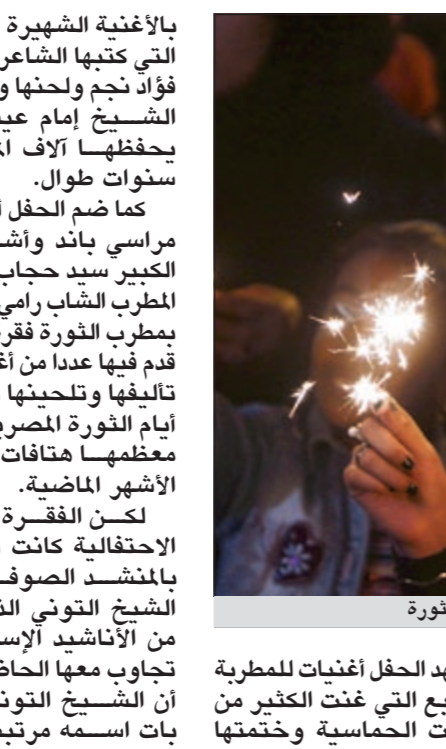
والشعور كانت حاضرة تخليدا لذكرى شهداء الثورة