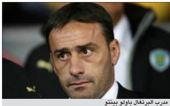
مدرب البرتغال باولو بينتو

اختير مدرب البرتغال باولو بينتو شخصية العام في بلاده متفوقاً على نجم ريال مدريد والمنتخب البرتغالي كريستيانو رونالدو واختير بينتو بعد أن قاد المنتخب إلى نهائيات يورو 2012 بعد أن كانت البداية عسيرة وقال بينتو بعد تسلمه الجائزة: «اختياري كشخصية العام سبغل دائماً شرفاً لي ووساماً على صدي، هذا لا يعد إنجازاً لأن الجميع عمل لتأهل المنتخب».