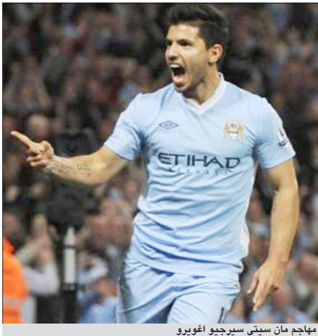
مهاجم مان سيتي سيرجيو أغويرو

في إحراز اللقب. وكان أرسنال المستفيد الأكبر من هذه الجولة لأنه الوحيد بين فرق المقدمة الذي حقق الفوز على جاره كوينز بارك رينجرز 1-0 ليصعد إلى المركز الرابع. ولعب فان بيرسي دور المنقذ مجدداً بتسجيله هدف المباراة الوحيد. وأهدر توتنهام فرصة الضغط على المتصدرين عندما اكتفى بالتعادل خارج ملعبه مع سوانسي 1-1. وانتزع نوريتش التعادل على أرضه مع فولام في الدقيقة الأخيرة 1-1. وتعادل بولتون مع ولفرهامبتون 1-1. وتعادل ستوك سيتي مع ويغان 2-2. وكان بلاكبيرن روفرز صاحب المركز الأخير قدم هدية ملغومة إلى السير اليكس فيرغسون في عيد ميلاده السبعين تمثلت بالحاقق الهزيمة بفريقه مان يونايتد 3-2 على ملعب اولدترافورد في افتتاح المرحلة.