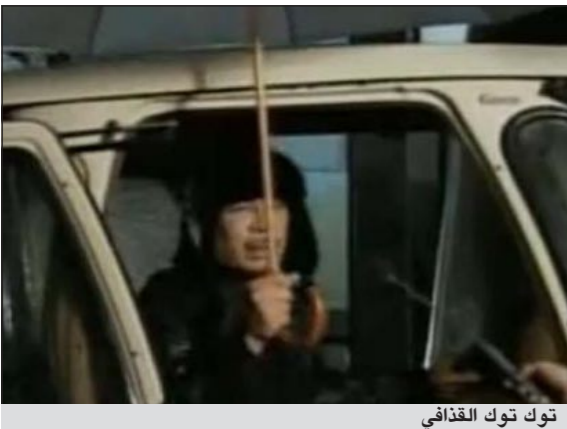
توك توك القذافي

القاهرة - أم.بي.سي: على الرغم من انقضاء عام 2011 وبداية عام جديد، إلا أن كثيرا من الصور والمشاهد التي التقطتها عدسات الكاميرا خلال العام المنصرم ما زالت عالقة في أذهان الكثيرين.