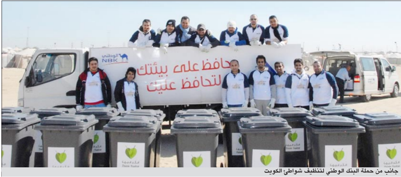
جانب من حملة البنك الوطني لتثقيف شواطئ الكويت