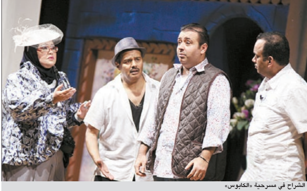
الشراح في مسرحية «الكابوس»