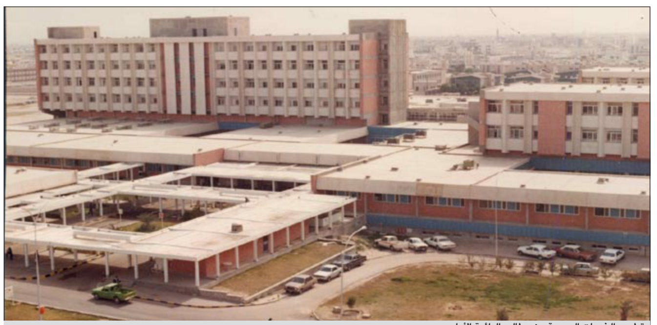
تطوير الخدمات الصحية من مطالب الدائرة الأولى