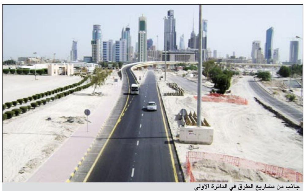
جانب من مشاريع الطرق في الدائرة الأولى