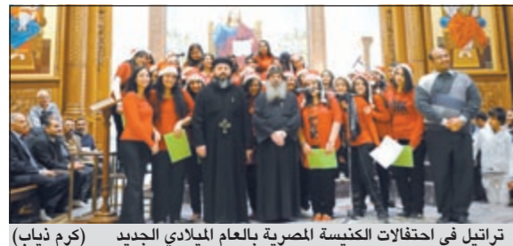
ترتابل في احتفالات الكنيسة المصرية بالعام الميلادي الجديد (كرم نياپ)

الأبنا بيجول لـ «الأخبار»: نتمنى حضور البابا شنودة افتتاح الكنيسة المصرية في الكويت 12