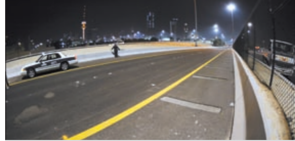
افتتاح الجزء المنجز من الدائري الأول أمام حركة المرور (هاني الشمري)

الأبنا بيجول لـ «الأخبار»: نتمنى حضور البابا شنودة افتتاح الكنيسة المصرية في الكويت 12