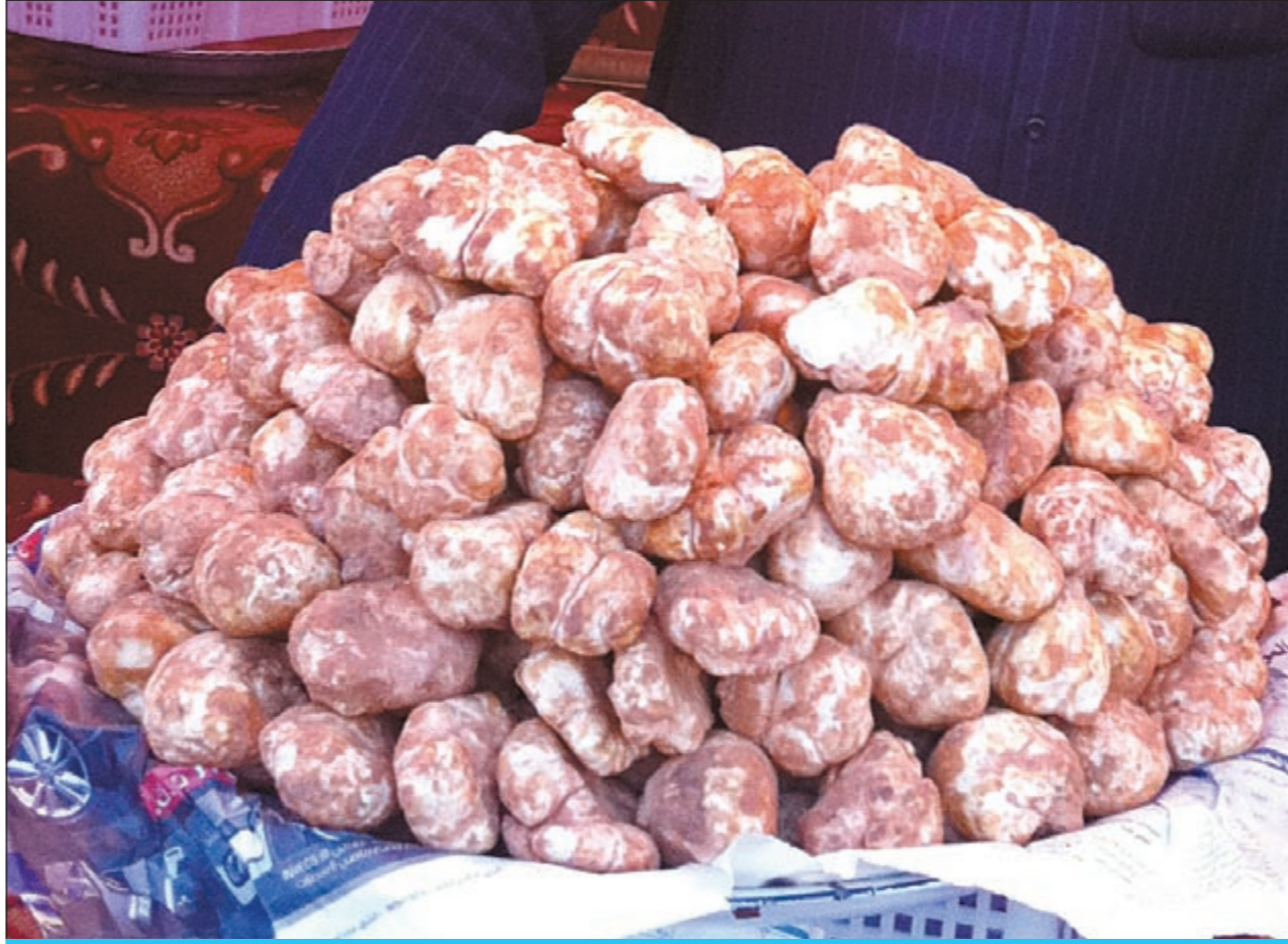
أسعار الفعق في الكويت خيالية ويصل الكيلو من الحبة الكبيرة إلى 25 ديناراً

أوضحت مصادر مطلعة لـ «الأخبار» أن أسماء المرشحين غير المنطبقة عليهم الشروط ستعلن قريباً. وقالت المصادر: أوشكت اللجنة القضائية التي يرأسها النائب العام بالإجابة صرار