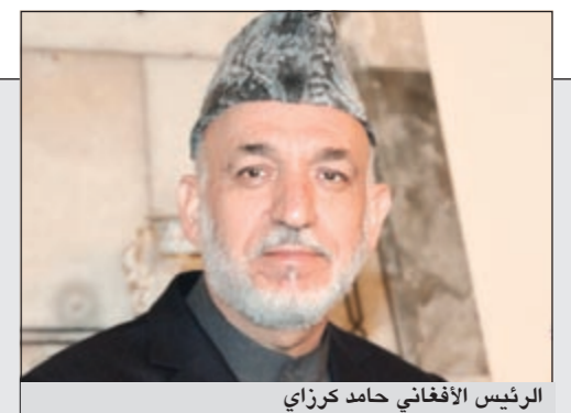
الرئيس الأفغاني حامد كرزاي

د. المذكور لـ «الأخبار»: للمرأة أن تنتخب ولا ترشح والبرلمان مؤسسة سيادية واقتامه أقضى مضجعا وأطلق أهل الكويت 26 27