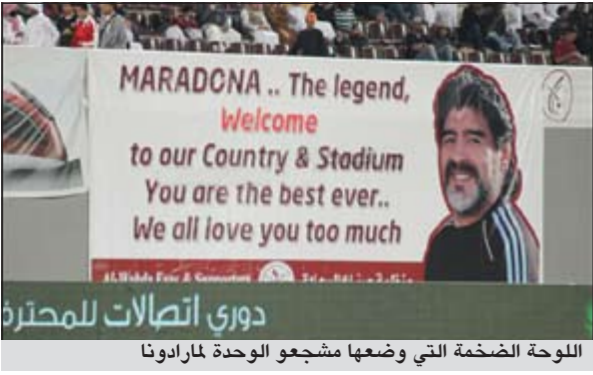
اللوحة الضخمة التي وضعها مشجعو الوحدة لمارادونا

اختبار اللاعبين قبل إشراكهم في المباريات. وفوجئ مارادونا وفريقه قبل اللقاء بلوحة ضخمة صنعها جمهور المنافس في ستاد آل نهيان بأبوظبي، تحمل صورته، والى جوارها عبارات تصفه بالأسطورة الكبيرة للتعبير عن حب جماهير الوحدة له. وأعرب النجم الأرجنتيني عن سعادته بهذا الترحيب، لكن خسارة فريقه، جعلته يتحدث