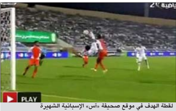
لقطة الهدف في موقع صحيفة «أس» الإسبانية الشهيرة

المشاهدة، وقد وضعت الفيديو الخاص بالهدف في موقعها على شبكة الانترنت، وتصدر القائمة الخاصة بمقاطع الفيديو في الموقع الذي يحظى بملايين الزوار يوميا.