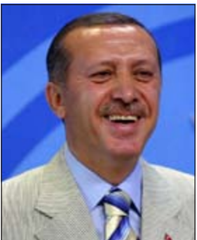
رجب طيب اردوغان

اسطنبول - كونا: حذر رئيس الوزراء التركي رجب طيب اردوغان الرئيس الفرنسي نيكولا ساركوزي من استغلال موضوع الفوز في الانتخابات الفرنسية المقبله. وقال اردوغان خلال الخطاب السنوي وجهه للامة التركية بمناسبة قدوم العام الجديد بأنه من غير الممكن قبول الاستغلال السياسي عبر تركيا من أجل الفوز في الانتخابات والحصول على الشعبية محذراً الرئيس الفرنسي من الأقدام على هذه الخطوة. ودعا اردوغان الى فتح الأرشيفات مرة أخرى وقال «سنعلن تدابيرنا خطوة خطوة استناداً الى مسيرة