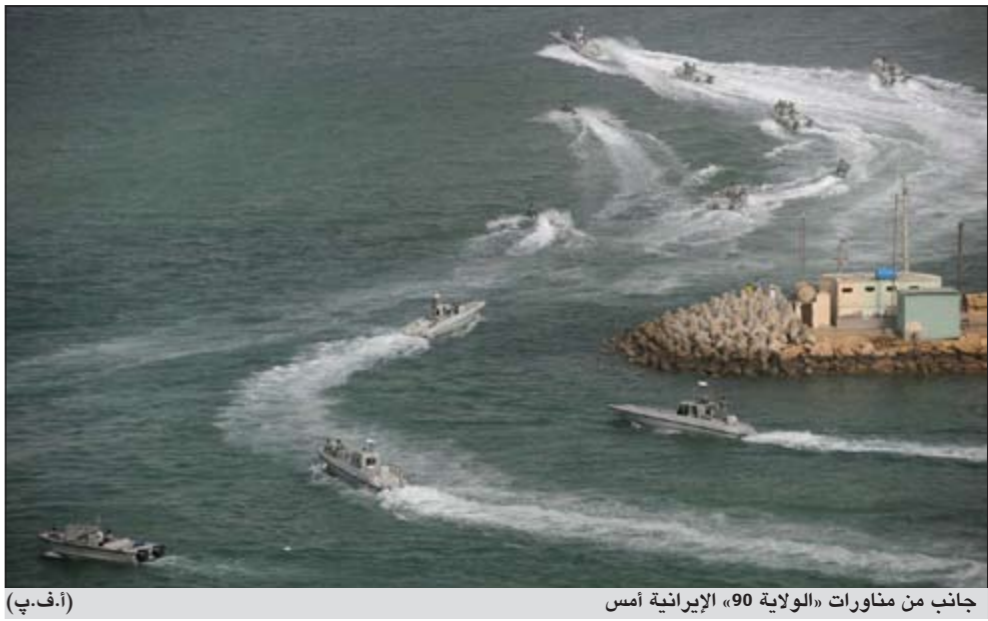
جانب من مناورات «الولاية 90» الإيرانية أمس