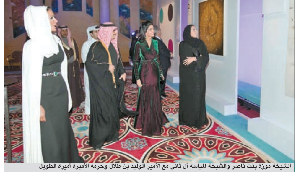
الشيخة موزة بنت ناصر والشيخة المياسة آل ثاني مع الأمير الوليد بن طلال وجرمه الأميرة أميرة الطويل

في حفل العشاء الخيري الرابع لمؤسسة أيادي الخير نحو آسيا (روتا)