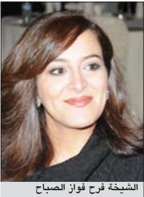
الشيخة فرح فواز الصباح