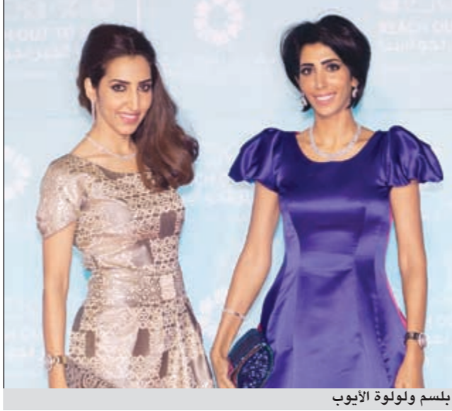
بلسم ولولو الأيوب