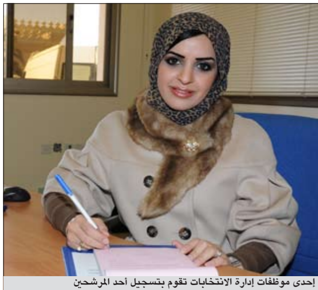
إحدى موظفات إدارة الانتخابات تقوم بتسجيل أحد المرشحين