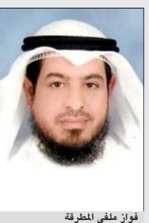
فواز ملقي المطرقة

أولا: انتخابات مجلس الأمة 2012 تواجه الحكومة الجديدة برئاسة سمو الشيخ جابر المبارك بشكل عام ووزارة الداخلية وعلى رأسها الشيخ أحمد الحمود بشكل خاص تحديا عظيما وهو اجراء انتخابات مجلس الأمة. ولاشك ان نجاح وزارة الداخلية في معالجة هذه القضية سيسهم بدرجة كبيرة في تحقيق الرضا الشعبي عن الأداء الحكومي ومن ثم الاستقرار والنهوض بهذا الوطن كما انه سيكون مسوغا مهما لاستمرار الحكومة في أداء