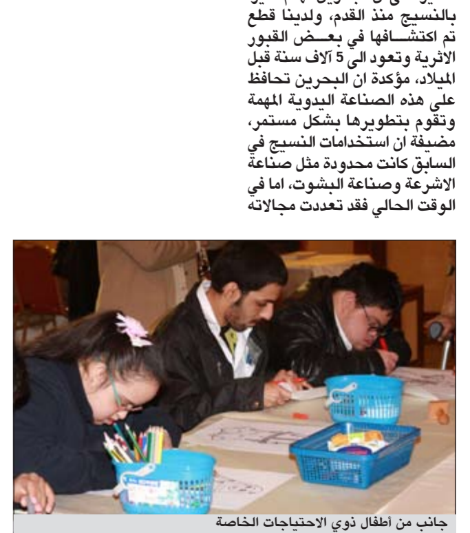
جانب من اطفال ذوي الالحاقات الخاصة

واصبح يدخل في الكثير من المجالات المهمة والحيوية مثل صناعة الاثاث المنزلي، وهي صناعة يدوية بالكامل، وكذلك في القطن حيث نستخدم قطننا طبيعيا ونا جودة عالية، ونحن نهتم بهذا المستوى من الجودة لانه يحمل اسم مملكة البحرين، ولدت ان المركز قام بتدريب الشباب البحريني على صناعة حرفة النسيج حتى تضمن المحافظة على هذه الحرفة التي توارثها الأباء عن الاجداد، ونحن توارثنا عن آباءنا، وسنسلم رايثنا للأجيال المقبلة، ولن نجعلها تندثر ايدا، واضافت اننا سننشئ في المستقبل القريب مركزا للتدريب الشباب على الحرف اليدوية حتى يمكنهم ان يبدعوا، ويخرجوا كل طاقتهم في هذا المجال.