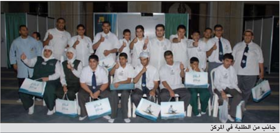
جانب من الطلبة في المركز

احتفل مركز الكويت للتوحد بفوز كوكبة من طلبة بمسابقة الكويت الكبرى الخامسة عشرة لحفظ القرآن الكريم وتجويده حيث تفضل صاحب السمو الأمير الشيخ صباح الأحمد بتكريم أبنائه الفائزين في حفل ضخم نظّمته الأمانة العامة للأوقاف بيلق بكلمات حفظة القرآن، وقد حرص مركز الكويت للتوحد على حفظ طلبته لكتاب الله عز وجل ومشاركتهم على مدى سنوات في تلك المسابقة وذلك إيماناً من المركز بأهمية وأثر حفظ كتاب الله في إنارة قلوب وبصيرة الطلبة وتنمية قدراتهم اللغوية ودوره في إحساس