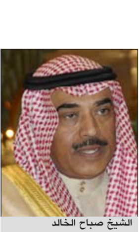
الشيخ صباح الخالد

الحالية على المستويين الإقليمي والدولي، من جانبه أعرب الشيخ صباح الخالد عن الشكر للوزير التركي على هذه المبادرة وذلك للتواصل البناء، معبرا عن تقديره لحرص الجمهورية التركية على استمرار التعاون والتنسيق المشترك مع الكويت بما يخدم العلاقات الثنائية، يذكر أنه يجري حاليا تنسيق إقليمي خليجي - تركي لتحديد موعد لعقد الجولة المقبلة من الحوار الإستراتيجي بين الجانبين والمقرر ان تستضيفه الجمهورية التركية مطلع العام المقبل 2012.