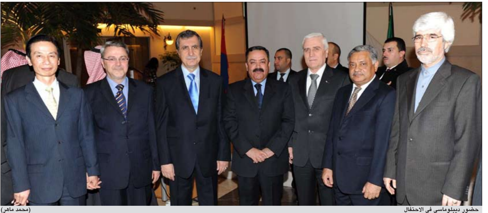
حضور ديبولوماسي في الاحتفال

أشاد وزير الخارجية التركي احمد داود اوغلو بعمق العلاقات التركية - الكويتية وتميزها في كل المجالات، مشيدا بالتعاون المشترك والمتنامي بين بلاده ودول مجلس التعاون الخليجي. وشدد الوزير التركي في اتصال هاتفي مع نائب رئيس مجلس الوزراء ووزير الخارجية الشيخ صباح الخالد على أهمية الاستقرار في المنطقة، وبحث اوغلو مع الشيخ صباح الخالد أيضا التطورات السياسية