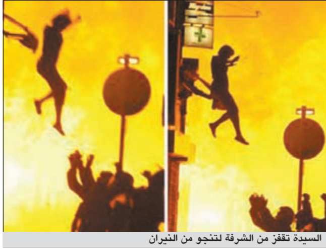
السيدة تقفز من الشرفة لتنجو من النيران

وفي منطقة كرويدون جنوب لندن لم تجد سيدة من إحدى دول شرق أوروبا حلاً لتنجو من النيران التي حاصرت المنزل إلا القفز من الشرفة لتنجو من الموت. وفي شرق مقاطعة يوركشاير، نجحت سيدة بريطانية من الموت بالرغم من انحراف سيارتها عن الطريق، وسقوطها 150 قدماً في سفح المنطقة الجبلية التي يمر بها الطريق، بحسب صحيفة «ديلي ميل» البريطانية.