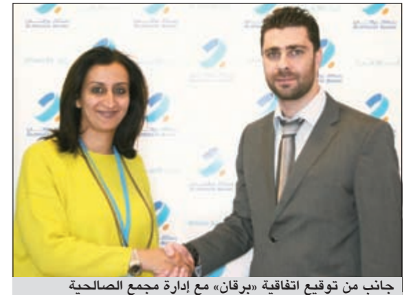
جانب من توقيع اتفاقية «برقان» مع إدارة مجمع الصالحية

أعلن بنك برقان عن إطلاق خدمة ومبادرة جديدة لعملاء بريميمير وحاملي بطاقات فيزا بلاتينيوم الائتمانية حيث يمكن لهؤلاء العملاء الاستفادة من خدمة تسلم وإيقاف سياراتهم مجاناً في مجمع الصالحية، وتستمر هذه الخدمة الخاصة لمدة عام كامل وتنتهي في ديسمبر 2012.