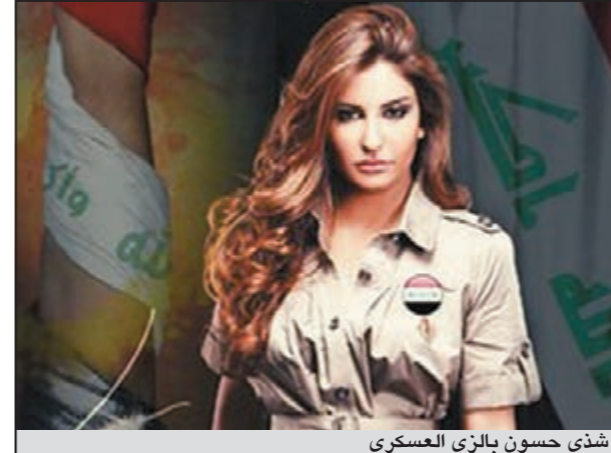
شذى حسون بالزي العسكري

أدانت النجمة العراقية شذى حسون، التفجيرات التي شهدتها العاصمة العراقية بغداد مؤخرا، بصورة وضعتها على صفحتها بـ «فيسبوك»، ارتدت فيها زيا عسكريا يحمل علم العراق، وعلى خلفية الصورة وضعت عبارة «سنبقى صامدين»، وكتبت أسفلها دعاء للعراق قالت فيه: «يا نار كوني بردا وسلاما على عراقنا»، حسب موقع «أم بي سي». وفيما استقبلت النجمة العراقية تعليقات عديدة مؤيدة لتفاعلها مع قضايا وطنها، انتقد البعض قصر الزي العسكري الذي لا يتلاءم مع جدية الموضوع الذي طرحه. وفي المقابل، أبدى أعضاء إعجابهم بتفاعل شذى مع قضايا وطنها.