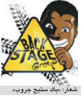
شعار: «باك ستيج جروب»