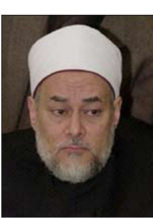
مفتي الجمهورية د.علي جمعة

أكد د.حازم شومان ـ الداعية الإسلامي ـ أن كل مسلم سوف يسأله الله سبحانه وتعالى عن عدم مناصرته للسلفيين في الانتخابات البرلمانية كما يسأله عن الصلاة والصوم، مشيراً إلى أن مناصرة السلفيين تعتبر نصرة لشرع الله وأن الإسلام سوف يأتي شاهدا يوم القيامة ويقول يارب هذا نصرني وهذا خذلني، ثم ناشد جميع الحضور بأن يواجهوا أصواتهم لمن ينصر شرع الله امتحالا لقول الله تعالى: (ستكتب شهدائهم ويسألون). موضحاً أن تطبيق الشريعة