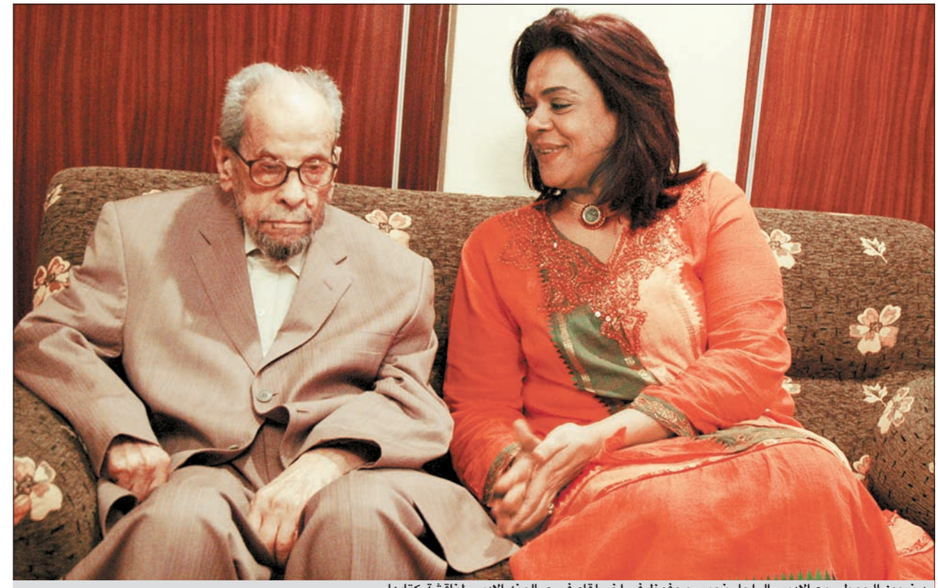
د. أمين الحوطي مع الراحل نجيب محفوظ في آخر لقاء في صالونه الأدبي لمناقشة كتابها

بمبنى الأمانة العامة للمجلس الوطني تم تجاهل دعوة رئيسة قسم النقد لأدب المسرحي في المعهد العالي للفنون المسرحية د.ترمين الحوطي لتكون من ضمن المتحدثين الرسميين في هذا الاحتفال، خصوصا أن لها كتابا صدر منذ سنوات بعنوان «سقوط المرأة في أدب نجيب محفوظ»، تناولت فيه كلا من رواية «اللس والكلاب» و«بداية ونهاية»، و«زقاق المدق»، وقد نوقش هذا الكتاب قبل دخول الراحل الكبير نجيب محفوظ حالته المرضية الحرجة، وذلك في آخر لقاء له في صالونه الأدبي وهذا اللقاء موثق بالتصوير المرئي والفيديوغرافي، وقد تصدت لكتابة مقدمة الكتاب وكيولة وزارة التعليم العالي سابقا والمستشارة حاليا في مجلس رئيس الوزراء الشبيخة