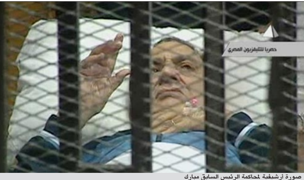
صورة أرشيفية لمحكمة الرئيس السابق مبارك

المرشح المحتمل لرئاسة الجمهورية إن الرئيس السابق حسني مبارك استخدم لفظ «التخلي عن منصبه» ولم يستخدم كلمة «التنحي» لأنه ظن أن التخلي يسمخ له قانونا بالعودة في الوقت الذي يريد عندما تستقر الأمور مادام التخلي قد تم بإرادته.