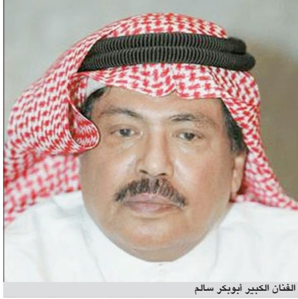
الفنان الكبير أبو بكر سالم