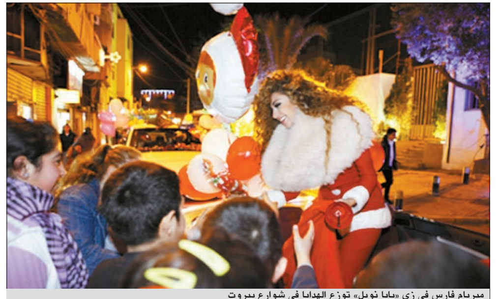
ميريام فارس في زي «بابا نويل» توزع الهدايا في شوارع بيروت

المهندس ليلة 30 ديسمبر في قاعة التزلج، وفي اليوم التالي ستوجه لبيروت لتحيي ليلة العيد في فندق الـ Movenpick بيروت. من جانب آخر، أعطى الممثل السوري دريد لحام رأيه بميريام فارس خلال حوار معه لمجلة «سيدتي»، قائلا: «هي فنانة موهوبة جدا صوتها جميل ولديها قدرات فنية ممتازة، وقد جسدت دورها الغنائي في فيلم «سيليما» بشكل جميل.. ولها الكثير من الاغاني الناجحة واتمنى لها التوفيق».