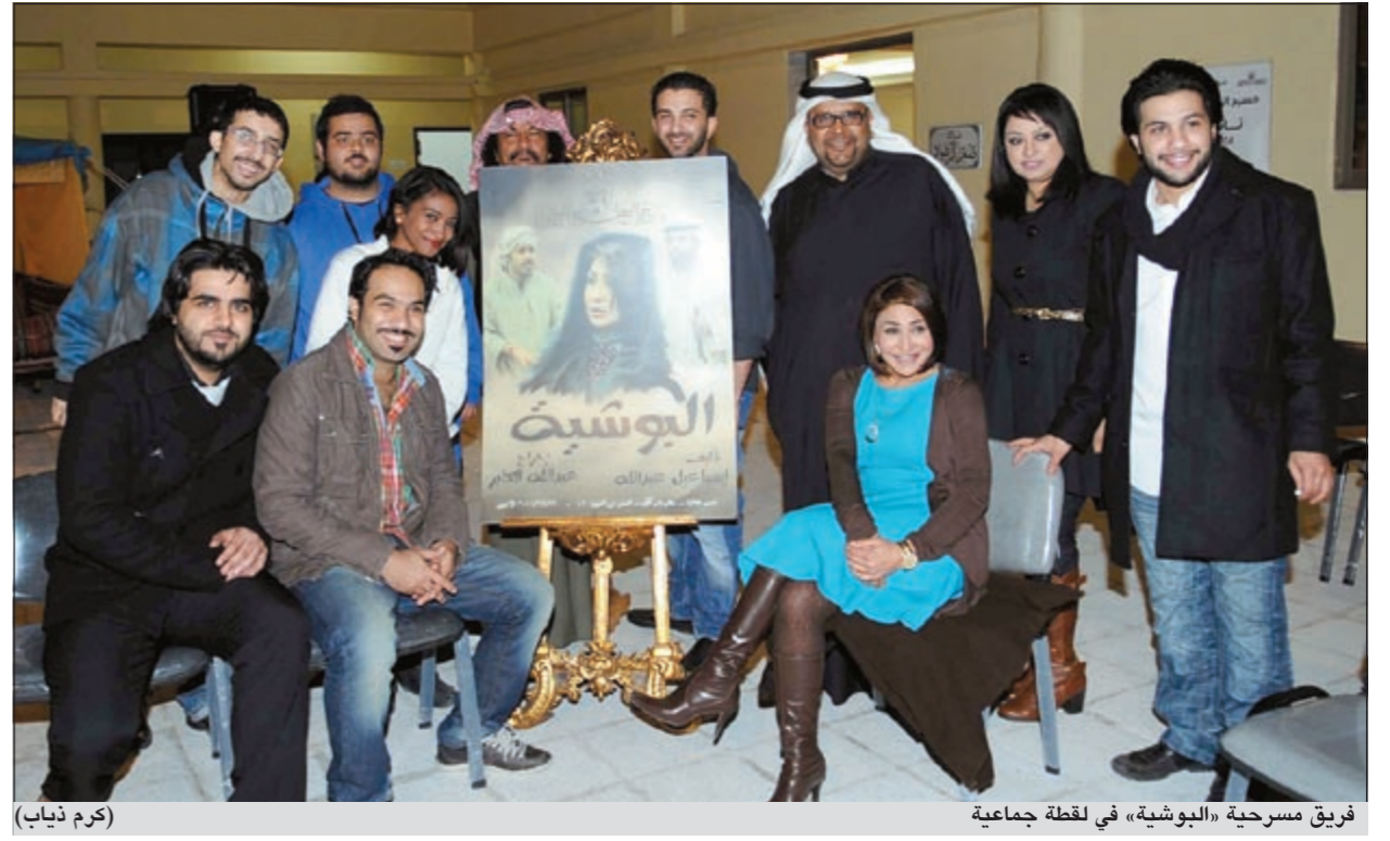
فريق مسرحية «البوشية» في لحظة جماعية

الكويتية، مضيفا: استشعر الجهود المبذولة والمخلصة من قبل الممثلين والاستعراضيين وجميع فريق المسرحية الذين ساهموا في رفع رأس فرقة مسرح الخليج.