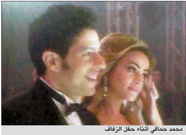
محمد حماقي أثناء حفل الزفاف

وأكد مرتضى ان محمد فؤاد أحيا الحفل جمالة لصديقة حماقي ولم يتقاض أي أجر مقابل هذا الحفل، كما أن عمرو دياب تنازل عن أجره واكتفى بالحصول على أجر الفرقة الجديرة بالذكر ان إليسا «عبدت» متابعيها بتغريدة افتتحت بها يومها، وقالت فيها: «صباح ميلادي مجد يا احبائي، لقد فتحت عيني للتو، لا ازال اشعر بالنعاس، سانام قليلا على ان التقى بكم فيما بعد».