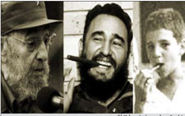
كاسترو في مراحل مختلفة من عمره

وبدأ كاسترو رسالته بعبارة «صديقي العزيز جدا روزفلت» كاتبا أنه ليس ملما بالإنجليزية «لكني أعرف منها ما يمكنني الكتابة اليك» ثم أخبره بتأثره به وإعجابه بقيادته وبأنه مثاله الأعلى، «فسي منتصفا كتاب عبارة: «لم أر أبدا ورقة 10 دولارات من الأخضر الأميركي، فأرجو أن ترسلها لي إذا أردت» ثم أنهاها بتوقيع.