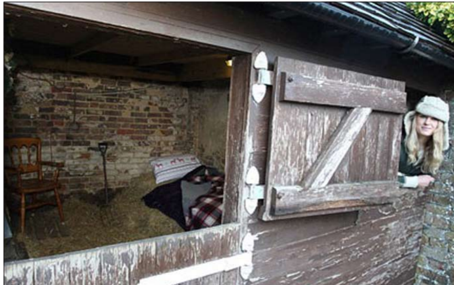
حظيرة الحمار بعد تحويلها إلى فندق

وكالات: أصبحت الفنادق منتشرة في جميع أنحاء العالم وذلك لزيادة عدد المسافرين والراغبين في قضاء عطلة ولذلك وجب التجديد والابتكار لجذب الزبائن. وحسب موقع كونتيل، فهناك العديد من الفنادق الغربية والفخمة وذات الأفكار المبتكرة والجاذبة للزبائن سواء كانت فوق سطح الأرض أو تحت أعماق البحار ومنها الطبيعي المخصص لبنى آدم أو المتنقل ومنها ما كان منشأ خصيصا للكلاب أو الدجاج، ولكن الجديد في مثل هذه الفنادق هذا الفندق الذي مازال يستخدم كحظيرة للحمار وقرر صاحبه وهما طبيبان تحويل منزل هذا الحيوان المسكين إلى غرفة فندقية 5 نجوم خلال فترة الكريسماس بسمر 12 يورو في الليلة.