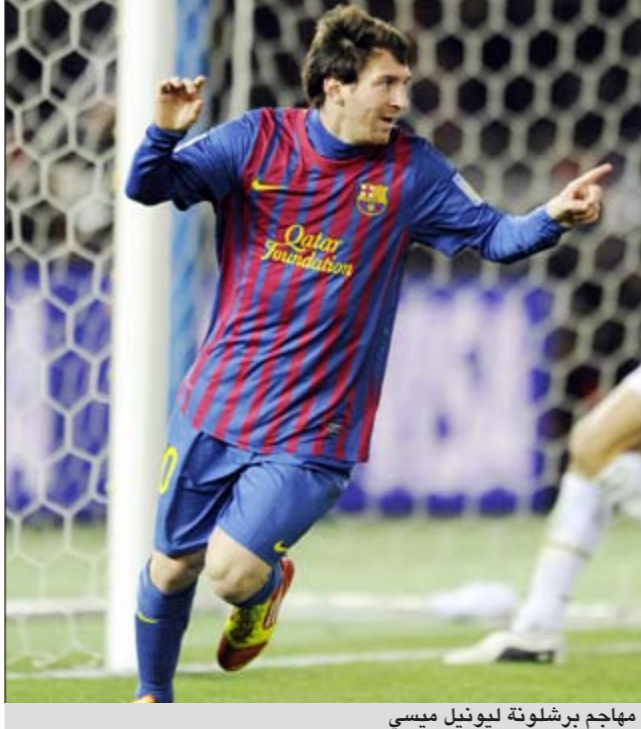
مهاجم برشلونة ليونيل ميسي

حذر المهاجم الدولي البرازيلي السابق المنتخب البرازيلي روماريو منتخب بلاده من خطر الخروج من الدور الأول لنهائيات كأس العالم لكرة القدم التي تستضيفها البرازيل عام 2014. وقال روماريو في تصريحات لصحيفة «أو غلوبو»: «إذا واصلت البرازيل اللعب بالطريقة التي تلعب بها حالياً فإننا نواجه خطر الخروج من الدور الأول». وانتقد الهدف السابق للمنتخب البرازيلي وفريق برشلونة الأسباني سرارا وتكراراً تنظيم كأس العالم خاصة أمام متطلبات الاتحاد الدولي (فيفا). وقال