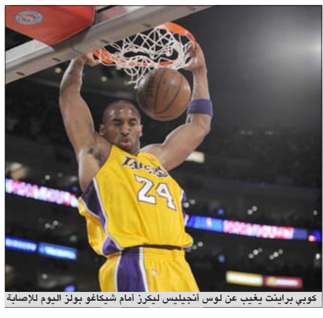
كوبي براينت يغيب عن لوس أنجليس ليكرز أمام شيكاغو بولز اليوم للإصابة

ويبدو دالاس مافريكس مع عملاقه الألماني ديرك نوفتسكي مرشحاً قوياً للحفاظ على لقبه الذي أحرزه العام الماضي على حساب ميامي هيت 4 - 2 في النهائي، على رغم تخليه عن تايسون تشاندلر المنتقل إلى نيويورك نيكس والبورتلوكي خوسيه باريا إلى مينيسوتا تمبرولفرز من أجل تقليص سقف الأجور لدى دالاس الذي أحرز اللقب لأول مرة في تاريخه. وسيكون ميامي هيت المدجج بنجومه الثلاثة ليريون جاميس ودواين وايد وكريس بوش، المرشح الأبرز لخطف اللقب