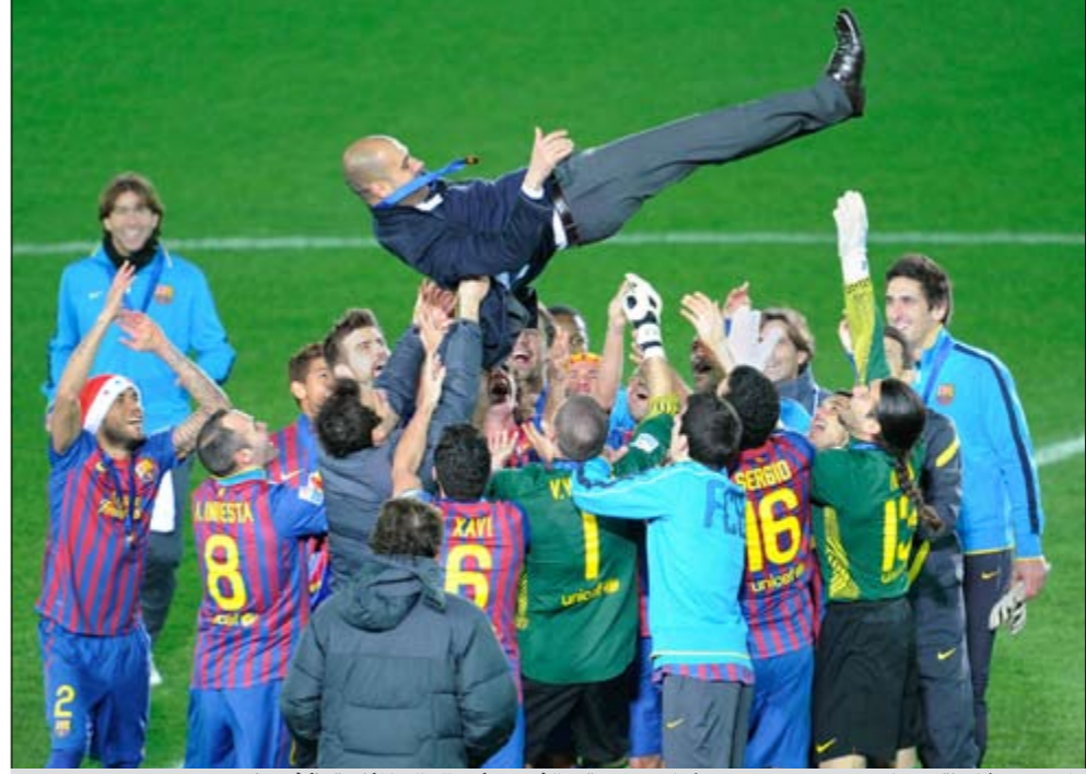
لاعب برشلونة يحملون مديرهم جوسيب غوارديولا عقب الفوز بكأس العالم للأندية

الابتكارات في ضح الحافز لدى المدرب الكاتالوني أيضاً. وأرب انه يبدو من الصعب معرفة إلى من ستميل إذا ما تحتم اختيار التجديد لشخص واحد فحسب بيته وبين النجم الأرجنتيني ليونيل ميسي هدف الفريق. وماذا يجب أن توقع غوارديولا على عقده الجديد؟ يرد روسيل قائلاً «من أجل السعادة، من أجل النتائج الجيدة، من أجل مجموعة اللاعبين، من أجل الحافز، من أجل الرغبة». ولو كان جانب من صحافة برشلونة قد مال قبل أسابيع إلى احتمال رحيل غوارديولا قبل نهاية الموسم، تبدو الرهانات اليوم مؤيدة للتجديد دون شك. في المقام الأول لأن الفريق لا تبدو عليه إمارات الإنهك أو انتهاء الطموح. ففي عامه الثالث مع برشلونة، توج فريق غوارديولا بكل الألقاب عدا كأس الملك. وليس ذلك كل شيء، بل أن غوارديولا يبدو أنه يستمتع على مقعد مدرب الفريق، وهو ما يبدو في ابتكاراته الخططية، وإبداعاته، ومناوراته من أجل تجديد حافز لاعبيه بشكل لا نهائي. وفي الوقت الحالي يفوز برشلونة وهو يلعب بطريقة 3-7-0، وهو ما عانى منه سانتوس البرازيلي قبل أسبوع بعد خسارته أمام فريق مدهش في نهائي بطولة العالم للأندية. كما تسهم تلك