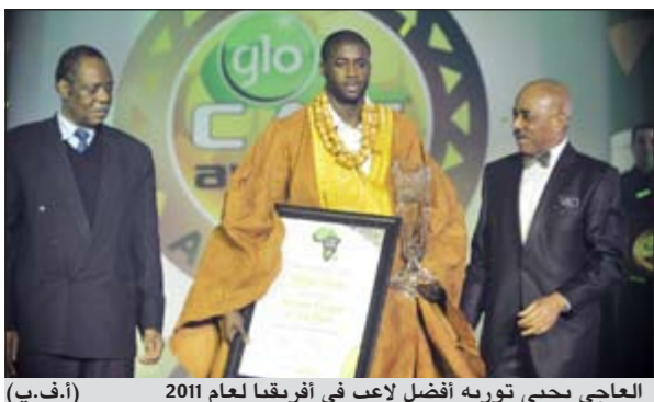
العاجي يحيى توريه أفضل لاعب في أفريقيا لعام 2011

قطع يحيى توريه شوطاً كبيراً في مسيرته الاحترافية منذ وصفه مدرب أرسنال الإنجليزي أرسين فينغر بـ«اللاعب المتوسط» قبل ثمانية اعوام ليصبح اليوم أفضل لاعب في القارة السمراء والقلب النابض لفريقه مان سيتي الإنجليزي ومنتخب بلاده ساحل العاج.