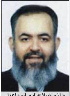
حازم صلاح أبو إسماعيل

أبدي الشيخ المرشح المحتمل لرئاسة مصر حازم صلاح أبو إسماعيل أسفه وحزنه لما يحدث من المجلس العسكري، وقال: لو كنا صدقناهم في أول الأمر لكان مبارك في مكانه حتى الآن. ووصف المجلس العسكري بأنه كان خائفاً بعد المليونيات الأولى ولكن تبدل هذا الخوف بعد تمجيد الكثير من الصحف للعسكري.