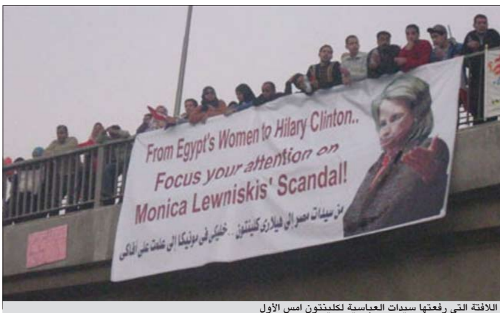
اللافتة التي رفعها سيدات العباسية لكلينتون أمس الأول

مونيكا ومتكلميش عن نساء المصريين»، بالإضافة إلى قيامهم بتعليق بوستر وضع عليه صورتها مع وضع علامة خطأ عليها. مصر لكلينتون خليك في مونيكا