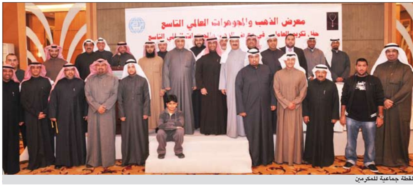
لقطة جماعية للمعرضين