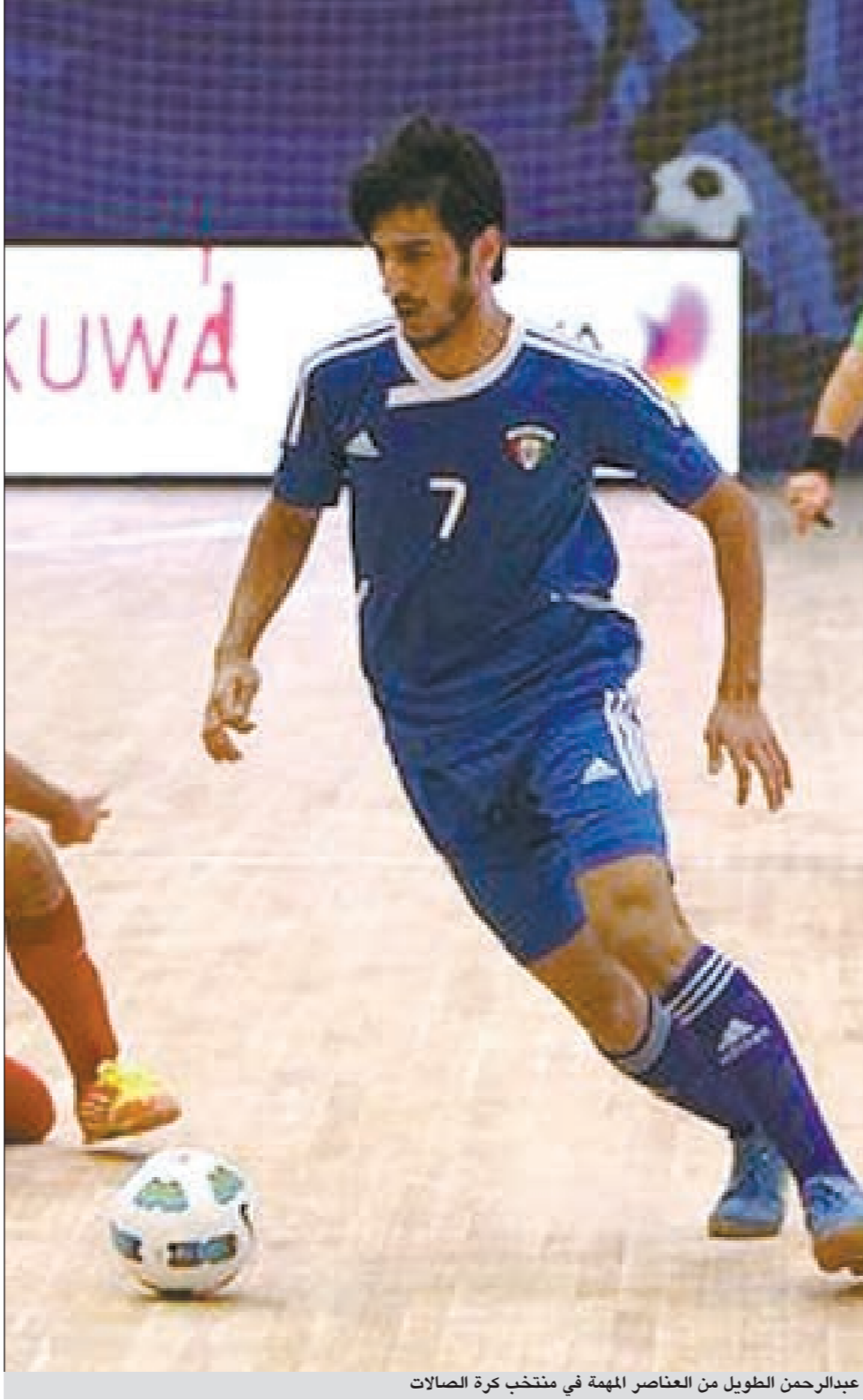
عبدالرحمن الطويل من العناصر المهمة في منتخب كرة الصالات