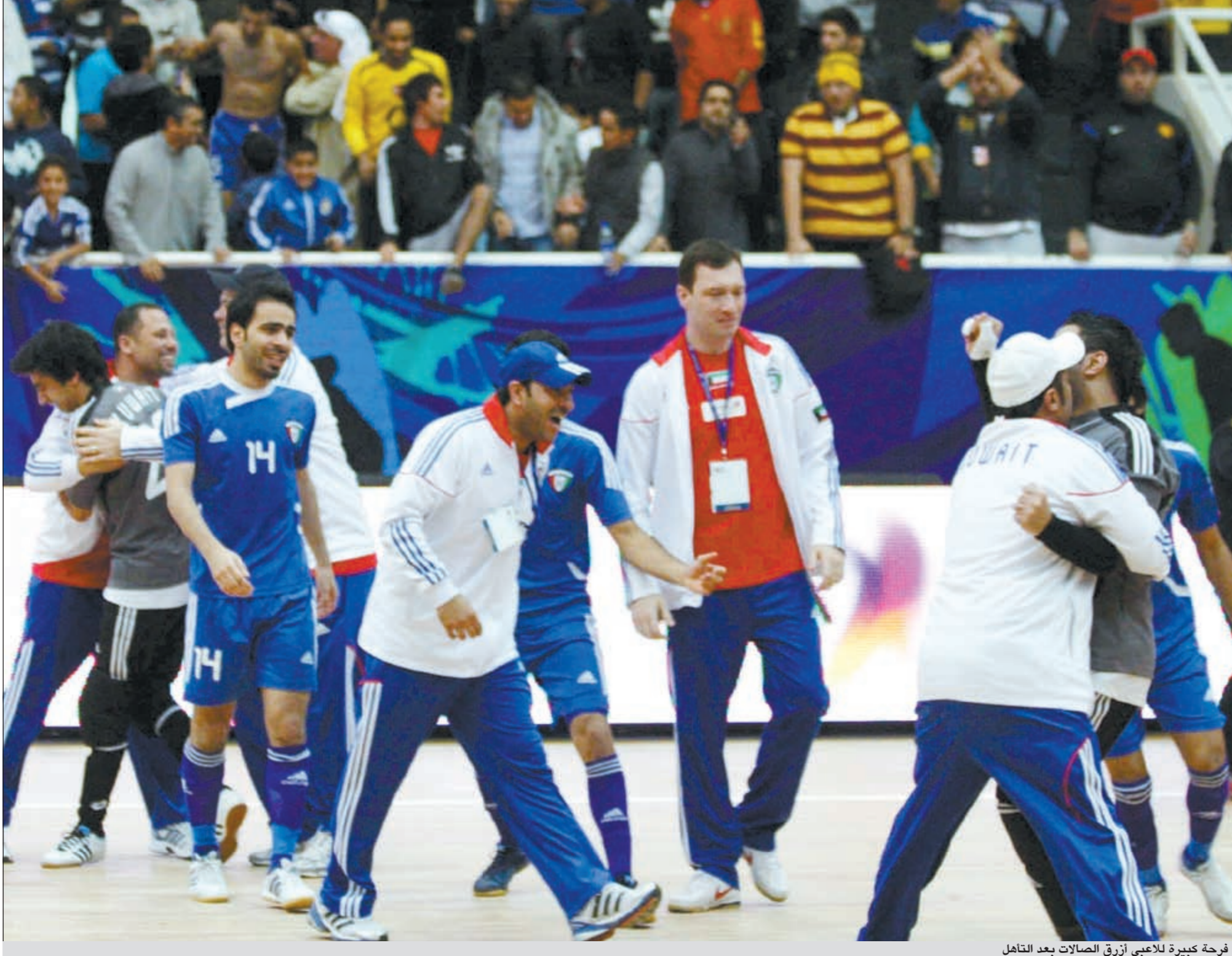
فرحة كبيرة للاعبين أزرق الصالات بعد التأهل