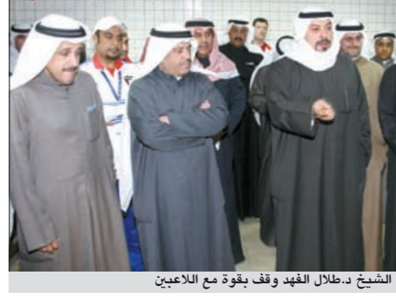
الشيخ د.طلال الفهد وقف بقوة مع اللاعبين

«الهيئة» تجاهلت إنجازنا ونطالب باقرار الاحتراف الجزئي أسوة باللاعب الأخرى