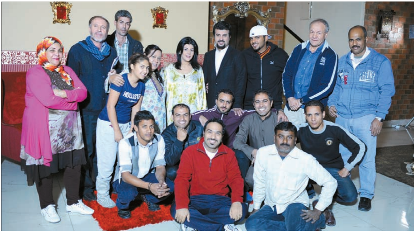
صورة جماعية لإبطال مسلسل «عشرة عمر»

نشرت الفنانة اللبنانية هيفاء وهبي على صفحتها الخاصة على تويتر صورتها وهي تمارس الرياضة في صالة الرياضة وعلقت على الصورة مازحة معجبيها أنها ستصبح مثل الممثلة العالمية جين فوندا. يذكر أن جين فوندا لاقت شهرة واسعة في الثمانينيات عندما نشرت فيلما مصورا يتضمن تمارين رياضية للحفاظ على الرشاقة واللياقة البدنية.