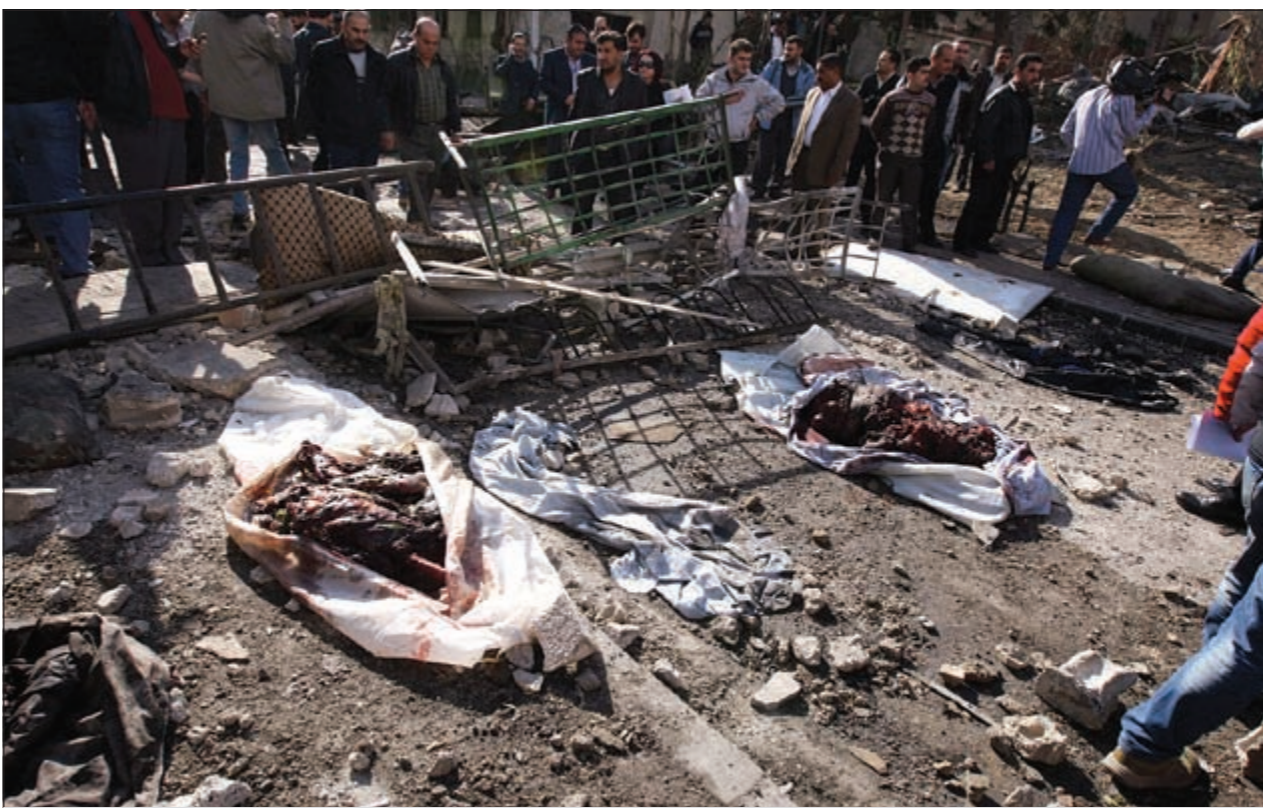
اشلاء ضحايا الانفجارين اللذين استهدفا مقر مخابراتية في دمشق

دمشق - هدى العبود وكالات بعد ساعات قليلة من وصول طلائع بعثة المراقبين العرب، امتزجت دمشق أمس بهجومين «انتحاريين» قوين استهدفا مقرين مخابراتيين في منطقة كفر سوسة وأسفرا عما لا يقل عن 70 قتيلًا و150 جريحًا، وجاء ذلك متزامنا مع خروج مظاهرات في عدة محافظات سورية تحت عنوان «بروتوكول الموت» أسفرت عن سقوط أكثر من 20 متظاهرا مدنيا برصاص الأمن السوري. وفيما أعلنت مصادر سورية ان معظم ضحايا الهجوم المزدوج من المدنيين إضافة الى عدد من العسكريين وأنه تم القبض على أحد المتورطين، قال الناطق باسم وزارة الخارجية السورية جهاد مقدسي ان التفجيرات التي استهدفت المقرين الأمنيين في العاصمة دمشق تحمل آثار الفكر السلفي للقاعدة، مشيرا إلى ان «وزارة الدفاع اللبنانية حذرت الجهات السورية من ان مجموعة من عناصر القاعدة تسلمت عبر بلدة عرسال اللبنانية الى سورية»، وشدد على أن «تفجيرات دمشق تحمل طبيعة التفجيرات التي ينفذها تنظيم القاعدة»، وفي السياق ذاته، زار وفد من مراقبي الجامعة العربية كان وصل دمشق قبل يوم واحد موقعي الانفجارين بعد وقوعهما بقليل. بينما أدانت الإدارة الأميركية تفجيرات دمشق معتبرة مع ذلك انها لا ينبغي ان تعيق عمل بعثة المراقبين العرب. وقال مارك تونر المتحدث باسم وزارة الخارجية ان «الولايات المتحدة تدن الاعتداءات بالقوى قوة» حيث انه «لا شيء على الاطلاق يمكن ان يبرر الارهاب».