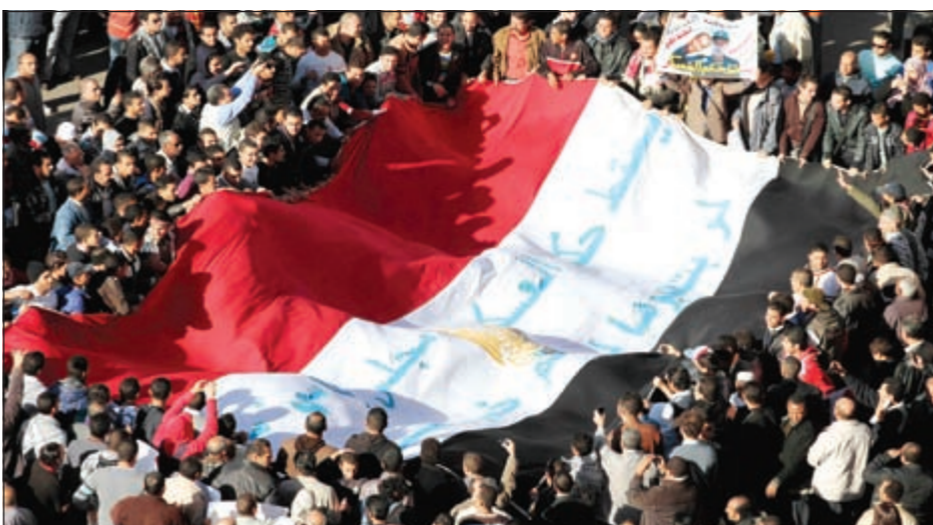
الآلاف المصريين يتظاهرون ضد المجلس العسكري في جمعة رد الشرف بالتحرير أمس

القاهرة - يو.بي.أي: انقسم الشارع المصري أمس حول تأييد المجلس العسكري الحاكم أو المطالبة برحيله الى قسمين، فبينما احتشد نحو 200 ألف يمثلون 37 حزبا وحركة وائتلافا سياسيا وثوريا من بينها التيار السلفي وحزبه «النور» بميدان التحرير تحت شعار «جمعة رد الشرف» مطالبين برحيله وإقالة حكومة كمال الجنزوري، وتظاهر نحو 20 ألف مواطن بحي العباسية تأييدا له في جمعة أطلقوا عليها «لا للتخريب» ورددوا هتافات «الشعب يريد سيادة الشورى»، ونصوا خياما لبدء اعتصام مفتوح «حتى يتم إنهاء اعتصام التحرير».