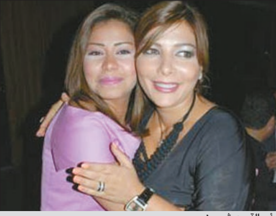
أصالة مع شيرين

انهالت الاتصالات على المطربة شيرين عبد الوهاب فور خروجها من المستشفى بعد التسمم الذي تعرضت له هي وزوجها، وذكر موقع «أنا زهرة» أن عددا من الفنانين سارعوا الى الاطمئنان على النجمة المصرية منهم أصالة نصري التي تجمعها به صداقة قوية حاليا. كذلك قام كل من احمد السقا، وزينة بزيارة شيرين وزوجها في المستشفى. وكانت الفنانة المصرية قد مكثت في المستشفى نحو 48 ساعة بعد تعرضها لحالة تسمم حادة نتجة تناولها وزوجها العشاء خارج المنزل، وعلى الفور تم نقلها الى المستشفى.