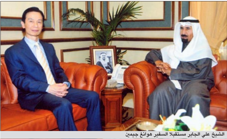
الشيخ علي الجابر مستقبلاً السفير فوانغ جيمين

من جانبه، شكر السفير جيمين الكويت اميرا وحكومة وشعبا على حسن تعاونهم وتعاملهم الراقى، متمنياً للكويت واهلها دوام التقدم والازدهار، وفي نهاية اللقاء شكر المحافظ السفير جيمين على جهوده الواضحة - خلال مسيرة عمله في الكويت - في تعزيز العلاقات الثنائية بين الكويت وجمهورية الصين الشعبية، وتتمنى له التوفيق والنجاح في عمله الجديد.