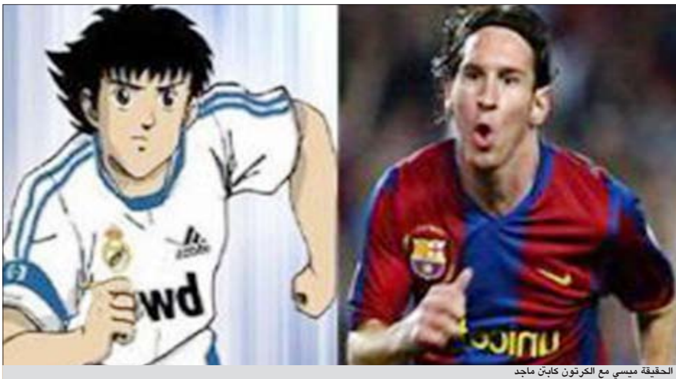
الحقيقة ميسي مع الكرتون كابتن ماجد

صدقات ميسي منذ الطفولة فيكتوريان النجم الأرجنتيني كان خجولا جدا ولطالما كان يلعب الكرة في الشوارع والفتيات كن متحمات به ويلاحقنه باستمرار، وقالت: كان طفلا رائعا تحبه الفتيات لكنه كان دائما يحب لعب الكرة، دائما ما كان يمارسها في الشارع، وأنه على الرغم من مشاغبات ميسي إلا أنه كان خجولا للغاية، وأنه لم يتغير حتى الآن.