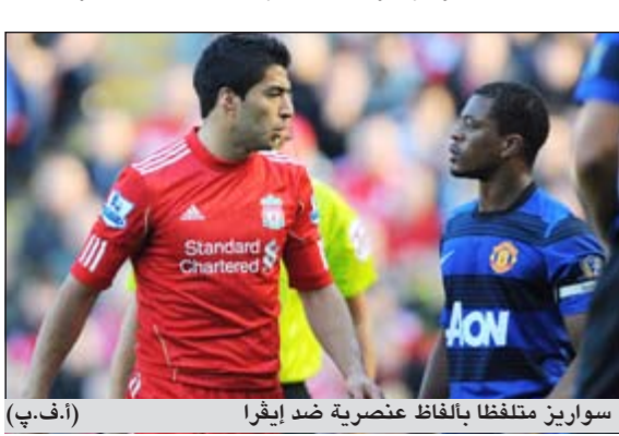
سواريز متلفظا بالفاظ عنصرية ضد إفريقيا

عبر ليفربول عن غضبه الشديد من قرار الاتحاد الإنجليزي بإيقاف مهاجمه الدولي الأوروغوياني لويس سواريز لثمانتي مباريات بسبب الإفاظ العنصرية التي وجهها المدافع مان يونايتد الفرنسي باتريس إيفرا خلال مباراة الفريقين (1 – 1) في الدوري المحلي في 15 أكتوبر الماضي. وذكر ليفربول في بيان أصدره بان الاتحاد الإنجليزي كان «عازما» على ايجاد سواريز مذنباً، معتبرا ان المهاجم الأوروغوياني لم يحصل على جلسة استماع عادلة. واضاف البيان «يبدو لنا ان الاتحاد الإنجليزي كان عازما على توجيه التهم ضد لويس سواريز حتى قبل مقابله في اوائل نوفمبر. لم نسمع اي شيء خلال جلسات الاستماع بإمكانه تغيير رأينا بان لويس سواريز بريء من التهم الموجهة اليه وستقدم للويس كل الدعم الذي يحتاجه الان من اجل تبرئة اسمه».