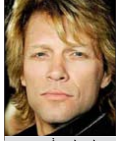
جون بون جوفي

لوس أنجيليس - يو.بي.أي: أكد المتحدث باسم النجم الأميركي جون بون جوفي أن الأخير بخير وهو حي يرزق خلافاً لكل ما نشر من تقارير عن وفاته. ونقل موقع «تي أم زد» الأميركي عن المتحدث باسم بون جوفي قوله أن كل التقارير الإلكترونية التي يتم تداولها عن وفاته عارية تماماً عن الصحة.