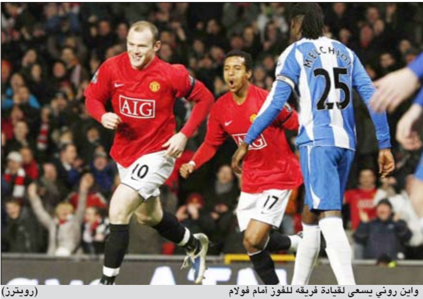
واين روني يسعى لقيادة فريقه للفوز أمام فولام