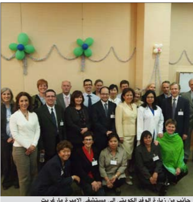
جانب من زيارة الوفد الكويتي الى مستشفى الاميرة مارغريت

التقى فريق علاج سرطان الثدي من مستشفى الأميرة مارغريت، بكندا بنظرأئهم في مركز الكويت لمكافحة السرطان خلال شهر نوفمبر المنصرم ضمن سلسلة زيارات متعددة ستقوم بها فرق طبية ذات خبرة عالية للكويت كجزء من التزم شبكة الصحة الجامعية حيث يعد مستشفى الأميرة مارغريت واحدا من أربعة مستشفيات تابعة لها، تجاه المساهمة في تعزيز مستوى الخدمة والرعاية في مجال الأمراض السرطانية، وتوفير خبرة سريرية لمركز الكويت لمكافحة السرطان «حسين مكي الجمعة سابقا»، مما يساعد على دعم وتطوير الخدمات التي يقدمها المركز في هذا المجال.