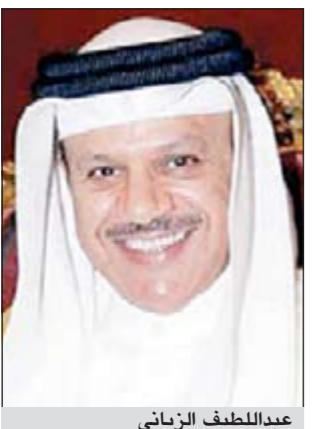
عبدالله بن زياتي

خليجي موحد لمواجهة الإشعاعات التي تعاني منها منطقة الخليج مطروح ضمن محاور قمة الرياض وذلك للتأكد من سلامة البيئة، مشيراً إلى أن ذلك لا يعني وجود خطر حالي ولكنها خطوة وقائية لرصد التلوث في أي بقعة كانت ومن ذلك التلوث الكيماوي. وأضاف أن قادة دول المجلس التعاون سيولون تعزيز التعاون الأمني والاقتصادي بين دول المجلس اهتمامهم، مشيراً إلى إدراج تقرير سيعرض أمام قادة دول مجلس التعاون حول آخر مستجدات ملف العملة الخليجية الموحدة والبنك المركزي الخليجي. وأشار الزياني إلى أن كافة اللجان التحضيرية للمؤتمر انتهت جميع تحضيراتها ورفعت توصياتها للمؤتمر الأعلى لقادة دول مجلس التعاون الخليجي لاتخاذ القرارات المناسبة حيالها.