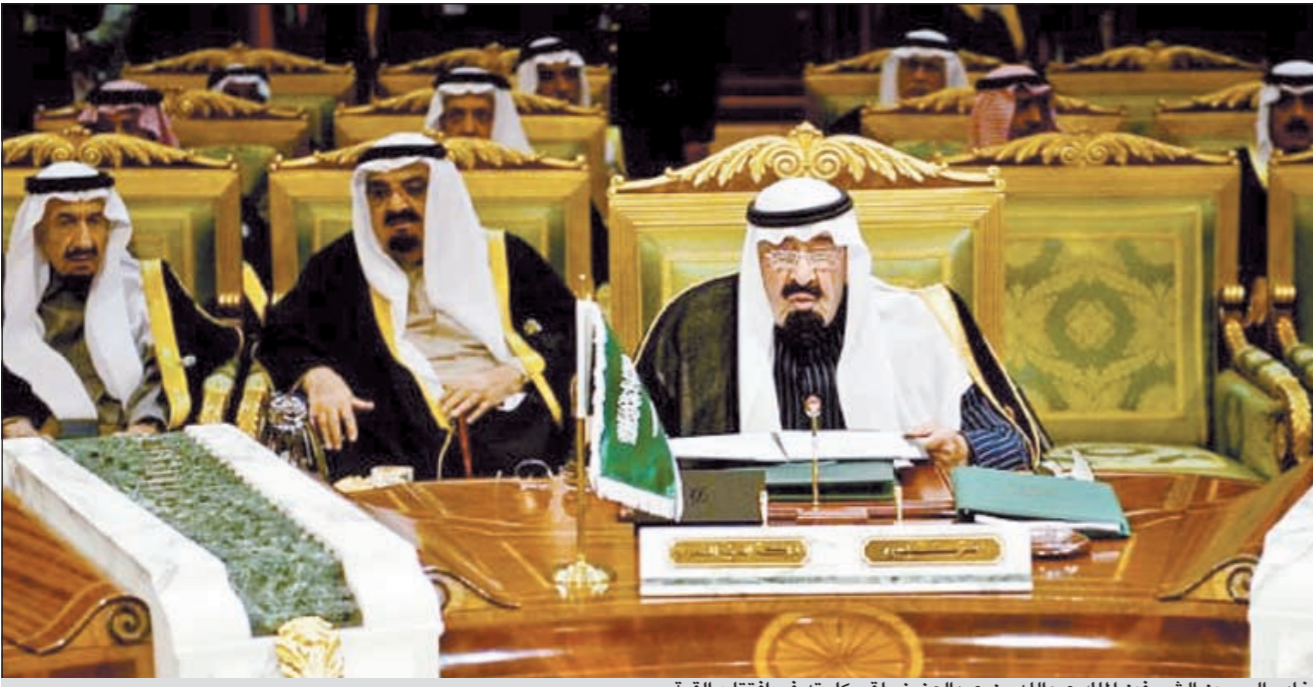
خادم الحرمين الشريفين الملك عبدالله بن عبدالعزيز يلقي كلمته في افتتاح القمة