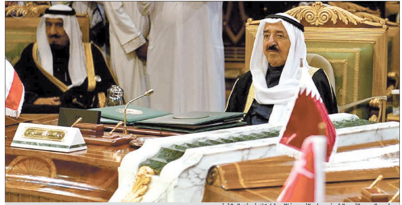
صاحب السمو الأمير الشيخ صباح الأحمد خلال مشاركته في أعمال القمة

التعاون المالي والاقتصادي. وفيما يخص الاتحاد النقدي الخليجي وما تم بشأن متطلبات المرحلة المقبلة المتمثلة في استكمال البناء المؤسسي والتنظيمي لأعمال المجلس النقدي وإعداد نظمته الأساسية ولوائحه التنظيمية، ومتطلبات إنشاء الجهاز التنفيذي للمجلس. فمن المتوقع أيضا أن يكون من المواضيع التي سيدخلها النقدي، خاصة بعد دخول العام الثاني على إطلاق دول مجلس التعاون الأعضاء مجلسها النقدي، وهو الجهة الفنية المعنية باتخاذ جميع الخطوات والإجراءات المتعلقة بالوحدة النقدية وبمهد لإنشاء البنك المركزي المنتظر.