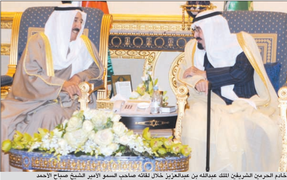
خادم الحرمين الشريفين الملك عبدالله بن عبدالعزيز خلال لقائه صاحب السمو الأمير الشيخ صباح الأحمد

أعلن خادم الحرمين الشريفين الملك عبدالله بن عبدالعزيز خلال الجلسة الافتتاحية لقمة دول مجلس التعاون في الرياض، أن الخليج «مستهدف بأمنه واستقراره»، داعيا دول الخليج إلى تجاوز مرحلة التعاون إلى مرحلة الاتحاد. وقال الملك عبدالله: «تجتمع في ظل تحديات تستدعي منا اليقظة وزمن يفرض علينا وحدة الصف والكلمة، ولا شك أنكم جميعا تعلمون أننا مستهدفون بأمننا واستقرارنا، لذلك علينا أن نكون على قدر المسؤولية الملقاة على عاتقنا». ودعا العاهل السعودي دول الخليج إلى «تجاوز مرحلة