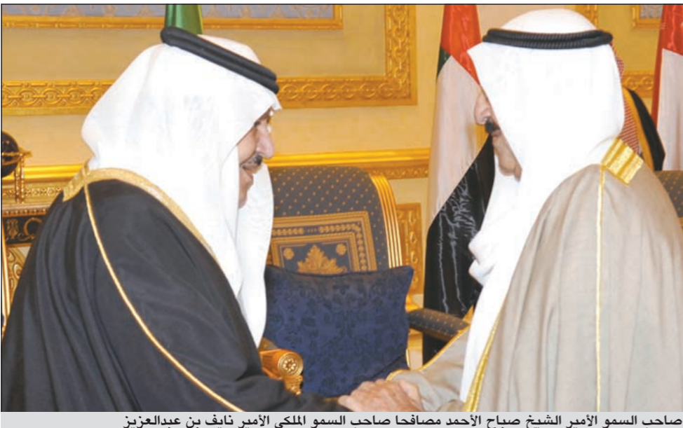
صاحب السمو الأمير الشيخ صباح الأحمد مصافحا صاحب السمو الملكي الأمير نايف بن عبدالعزيز