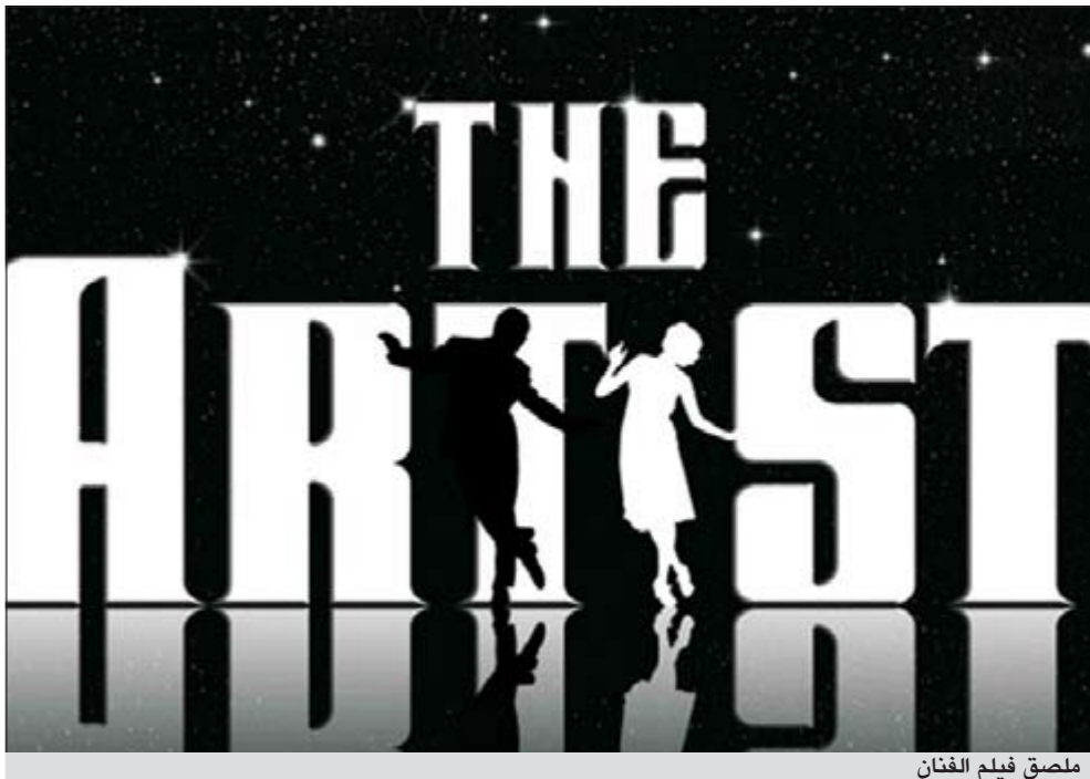
ملصق فيلم الفنان

وقد علق مخرجه الفرنسي ميشال هازانافيسوس على الأمر بقوله «اشعر أن بسمة عريضة بلهاء ترسم على شفتي. لقد أنجزت هذا الفيلم بدافع الرغبة ولم أتوقع أبدا تجاوبا كهذا».