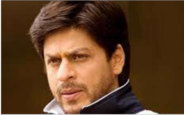
شاه روخ خان

التألق، وتحظى بها مهرجانات الدنيا من «كان» الي «فينيسيا» الي «برلين»، إلا أنها تحظى بمكانة خاصة في مهرجانات دول الخليج الحديثة، حيث عرض له أحد أفلامه «دون 2»، كما عرض له ضمن قائمة الأفلام الهندية الأكثر تأثيرا في العالم خلال العامين الأخيرين «اسمي خان» الذي يقدم بأسلوب سينمائي وإبداع فكري حقيقة الإسلام، باعتباره لا يعادي الآخر أبدا، ليرفع كثيرا من الظلم الذي يطارد المسلمين في كل أنحاء العالم، باعتباره إرهابيين.