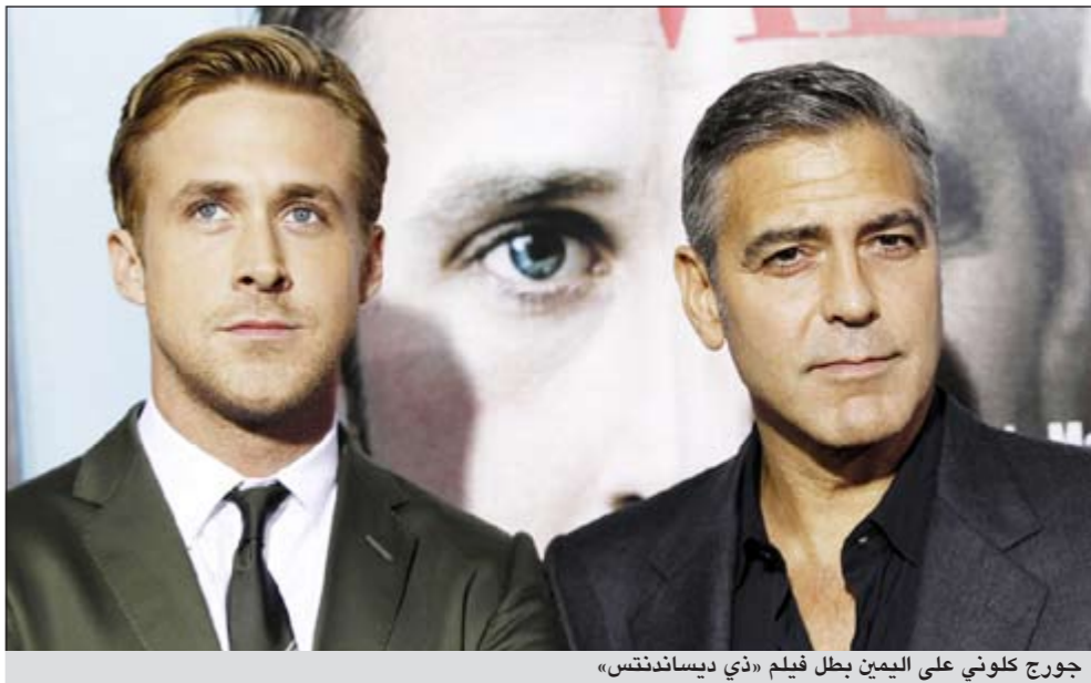
جورج كلوني على اليمين بطل فيلم «ذي ديساندنتنس»

الان «ذا ارتيست» (الفنان) كان الراجح الأكبر