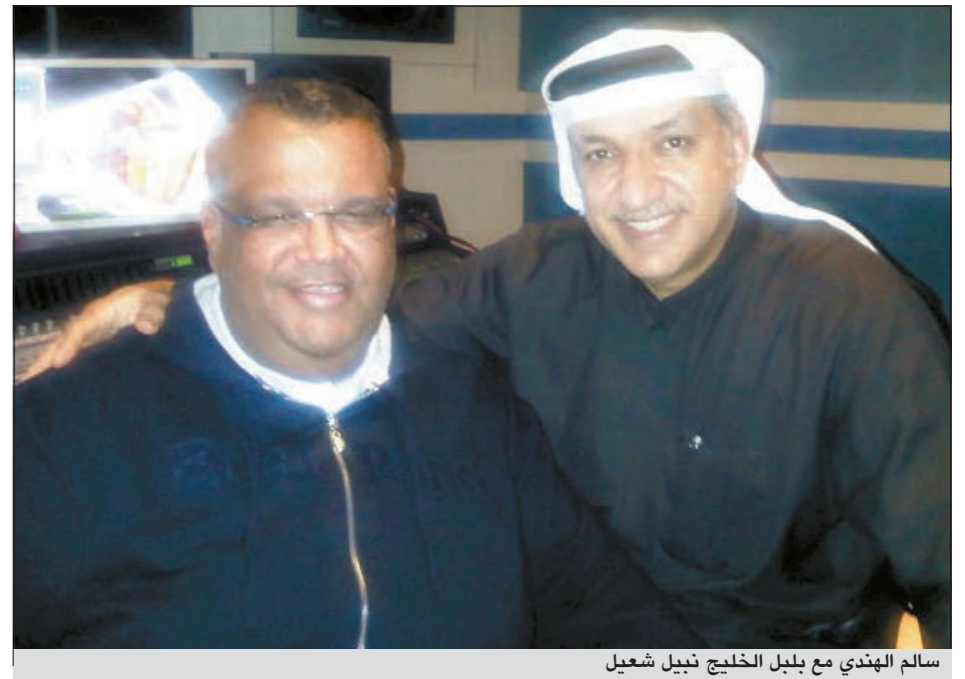
سالم الهندي مع بلبل الخليج نبيل شعيل