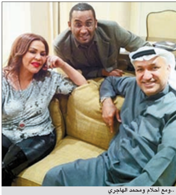
..ومع أحلام ومحمد الهاجري

بيروت: نشر رئيس روتانا للصوتيات والمرئيات سالم الهندي على صفحته الخاصة على «تويتر» صورة تجمعته مع بلبل الخليج الفنان نبيل شعيل كهدية لمعجبيه. وأشار الهندي على حسابه الخاص الى أن ألبوم «شعيل 2012» سيصدر قبل نهاية العام الحالي وكتب لحبي بوشعيل: «اجتمعت مع فناننا المحبوب نبيل شعيل واستمعنا الى