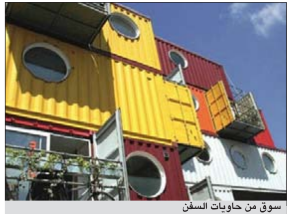
سوق من حاويات السفن

لندن - سي إن إن: في خطوة باتجاه مستقبل المعمار التجاري العالمي، افتتح هذا الأسبوع أول سوق تجاري متنقل صنع بالكامل من حاويات السفن المعاد تدويرها فيما تسمى بمبينة الضباب، لندن. واستغرق صنع هذا المركز المسمى «Boxpark»، عاماً كاملاً وتم استخدام 60 حاوية سفن مكدسة على طابقين ويقع شرقي العاصمة لندن بجوار شارع الموضة المعروف شورديتش. مؤسس الـ «Boxpark»، رجل الأعمال البريطاني، روجر وايد، قال لـ «سي إن إن» داخل إحدى محال المركز: «عندما بدأت في مجال بيع الملابس في إحدى الأكوام التي أحلم بأن أشحن بضاعتها على إحدى هذه الحاويات إلى هونغ كونغ».