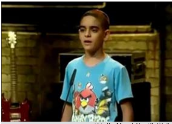
الطفل الإسرائيلي يغني لأم كلثوم

فجر فيديو لطفل إسرائيلي يغني لأم كلثوم جدلاً على اليوتيوب بين مؤيد ومعارض، حيث يرى البعض أنه تجسيد لمحاولات إسرائيل للتطبيع مع الشعوب العربية عبر أغانيها المضلّة، فيما قتل البعض منه، مؤكداً عالمية الفن، والتي تجعل التراث الفني متاحاً لأي إنسان ليستمتع به. ويظهر الطفل في الفيديو، وهو يرتدي «الطاقية اليهودية» ويغني أغنية «انت عمري» لأم كلثوم ضمن برنامج لاكتشاف المواهب، وهو ما استغفر «حسام 20» الذي سأل عن أسباب ارتدائه الطاقية، وقال: «عايزين يؤكدوا على الهوية الإسرائيلية، وفي نفس الوقت يؤكدوا قبولهم للآخر». واستطرد: «والله لو غنيت ابتهاجات النقشبندية حتى.. مش هتغنوا علينا برضو يا سفاحين الدم».