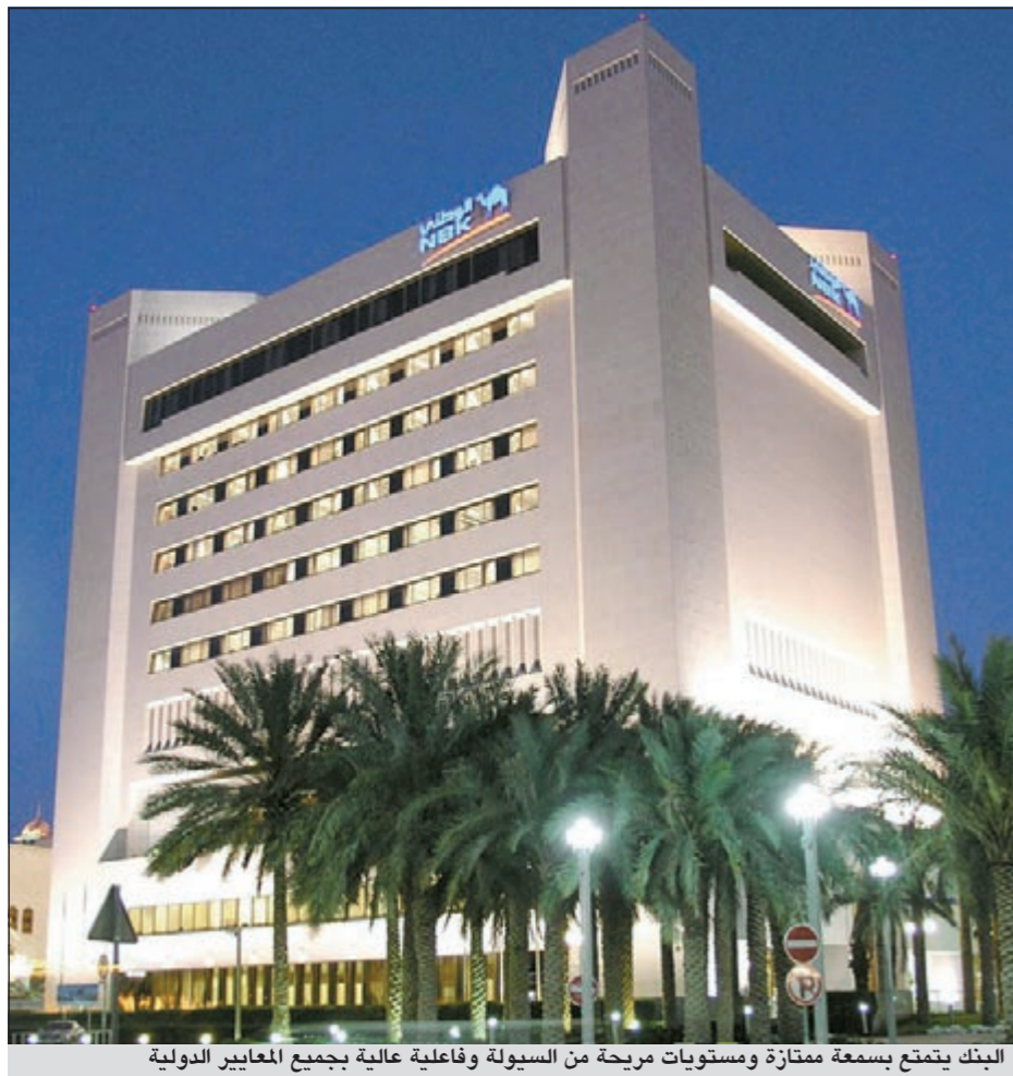
البنك يتمتع بسعة ممتازة ومستويات مريحة من السيولة وفاعلية عالية بجميع المعايير الدولية

وقالت «موديز» أن موقع «الوطني» المميز في السوق المحلية وتوسعه الإقليمي يجعلانه أفضل بنك في القطاع المصرفي من حيث تنوع مصادر الدخل، كما